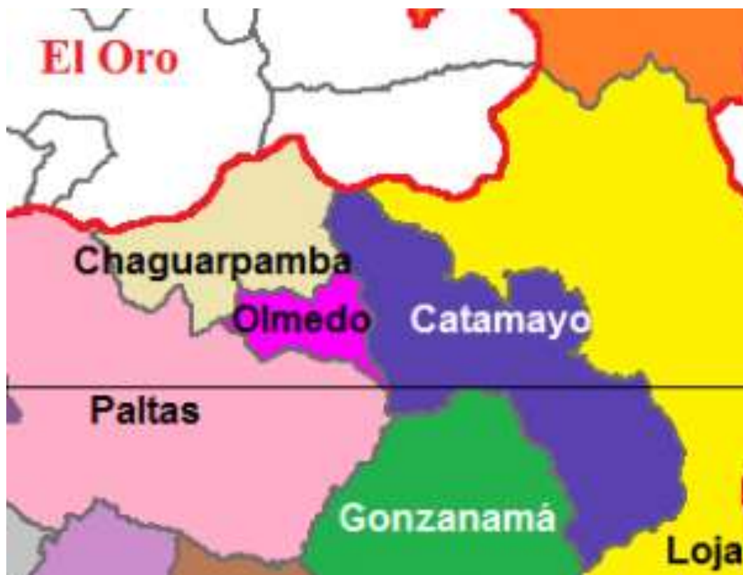
Ilustración 1: Distrito 11D02 Catamayo-Chaguarpamba-Olmedo Educación