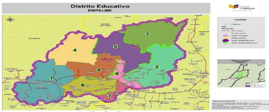
Gráfico 1. Elaborado por la Dirección Distrital 09D15, fuente (INEC).

El objetivo que nos planteamos al presentar este informe es aportar información del Nuevo Modelo de Gestión Educativa, Es decir, busca influir de manera directa sobre el acceso universal y con equidad a una educación de calidad y calidez, lo que implica ejecutar procesos de desconcentración desde la Planta Central hacia las zonas, distritos y circuitos, para fortalecer los servicios educativos y aproximarlos hacia la ciudadanía, atendiendo las realidades locales y culturales.