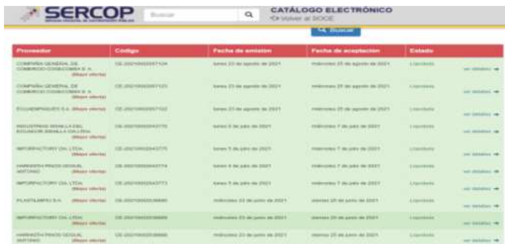
Tabla 30. Elaborado por la División Distrital Administrativo Financiero de la Dirección Distrital 09D15