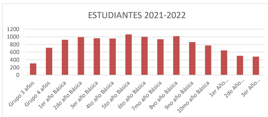
Gráfico de la Población Estudiantil de las instituciones educativas con sostenimiento fiscal 2021-2022.

En distrito 09D10 – Juan Gómez Rendón Progreso, en cumplimiento del Currículo Vigente ajustado a las necesidades de aprendizaje de la comunidad educativa, junto con los recursos que han asegurado las condiciones mínimas han permitido garantizar los procesos de enseñanza y aprendizaje de calidad.