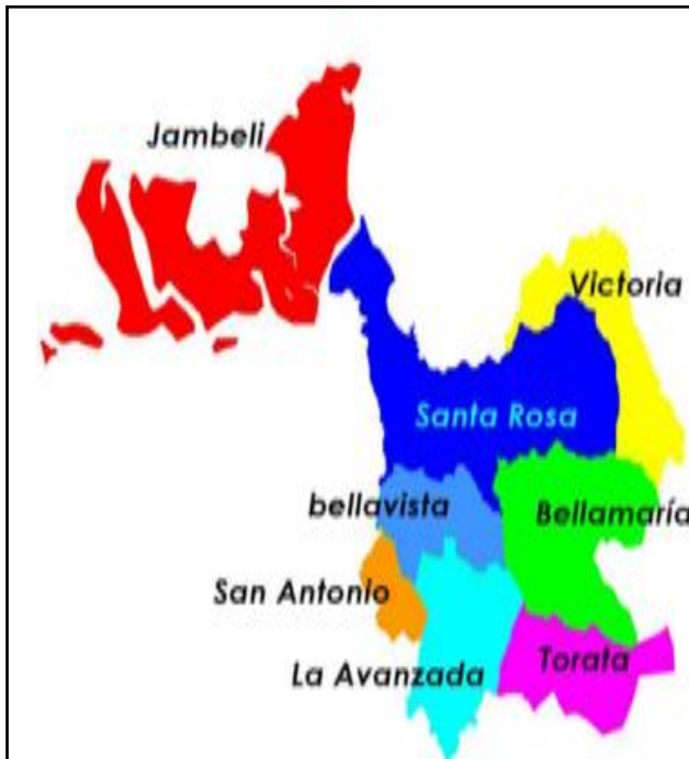
Gráfico N° 1: Distribución del Distrito 07D06 y Circuitos.