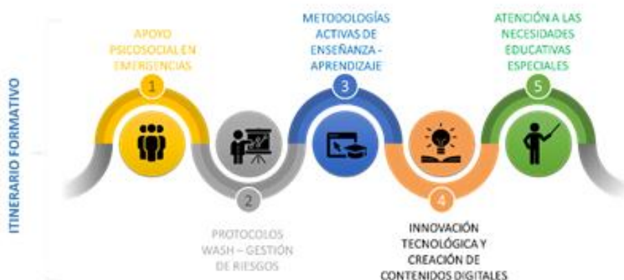
Ilustración 6: Itinerario formativo emergente