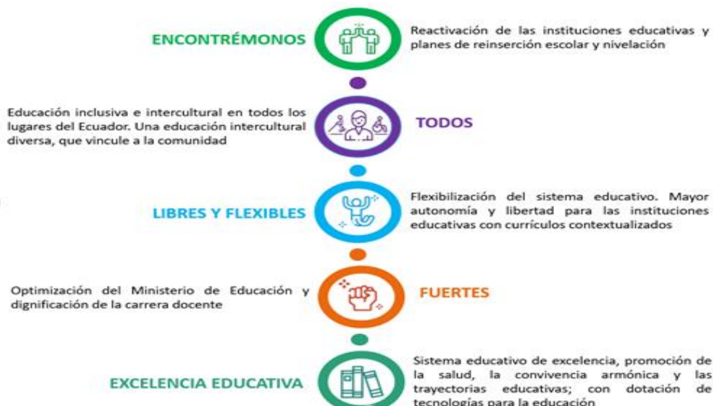
Ilustración 5: Articulación de la planificación del Ministerio de Educación con los instrumentos de política nacional

En el 2021, la planificación del Ministerio de Educación se operativizó bajo los siguientes ejes de trabajo: