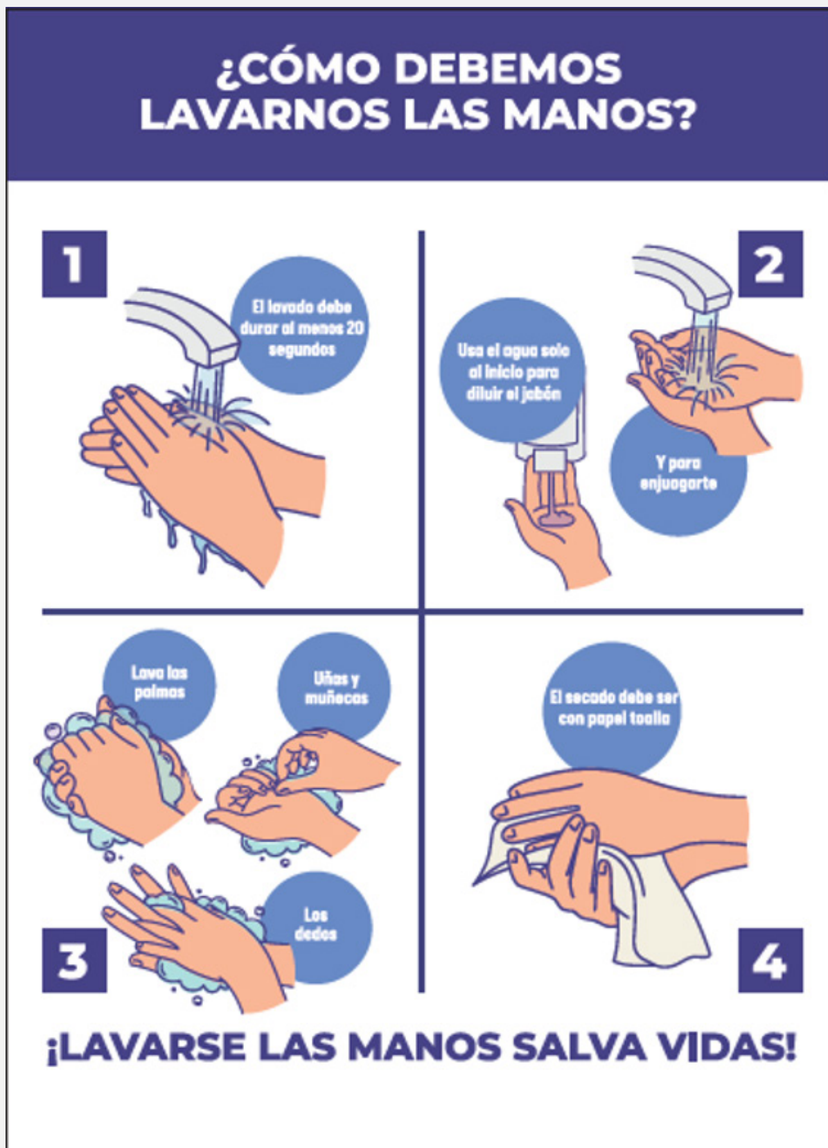
GRÁFICO 2. Lavado de manos relacionados a COVID-19