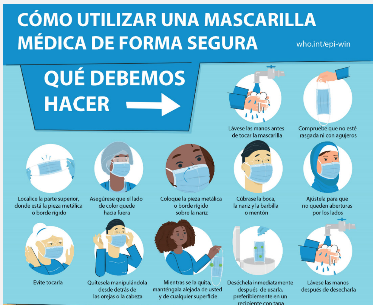
GRÁFICO 1. Uso de la mascarilla relacionados a COVID-19