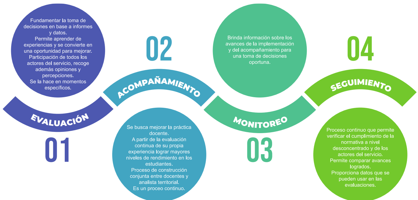
Gráfico 1 Características del sistema

La gráfica que se expone a continuación muestra las características principales del sistema.