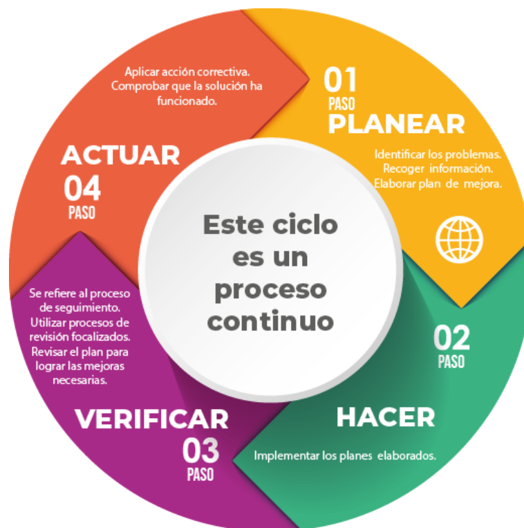
Gráfico 5 Esquema de mejora continua

La mejora continua es una estrategia para perfeccionar la calidad de los procesos y del servicio en sí. Además, en base a la información recopilada del servicio, permite tomar decisiones oportunas para solucionar problemas encontrados. La siguiente gráfica muestra un esquema de mejora continua en 4 pasos.