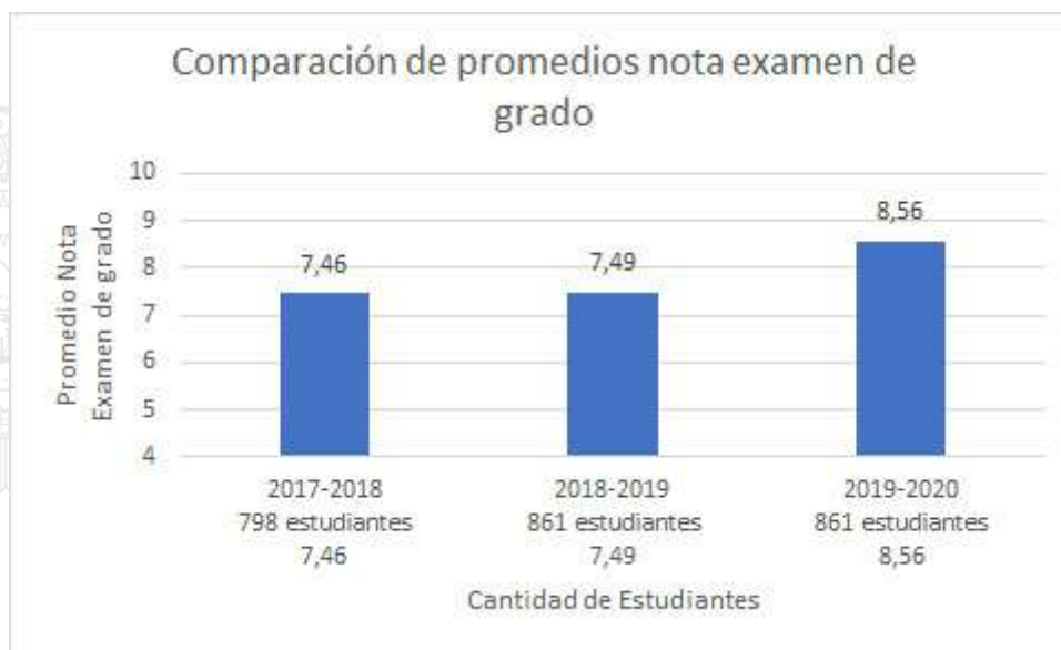
Fig.1 Comparación promedios notas de examen de grado.

Elaborado por: Unidad Distrital de Apoyo Seguimiento y Regulación