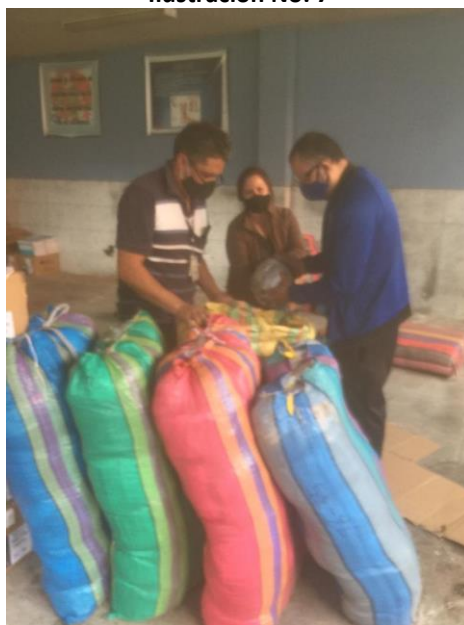
Dotación de uniformes escolares

37 instituciones educativas pertenecientes a la pandemia COVID Dirección Distrital de Educación 17D06 Parroquias Urbanas (Chilibulo a la Ferroviaria) y Parroquias Rurales (Lloa), forman parte del programa “Hilando el Desarrollo”, mediante, la entrega gratuita de 9.495 kits de uniformes escolares destinadas a todos los niños y niñas de instituciones educativas fiscales y fiscomisionales