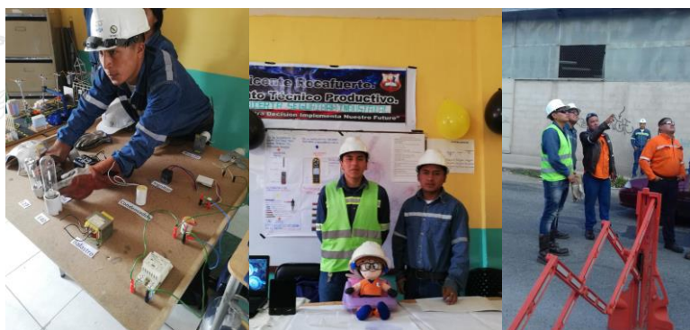
ACTIVIDADES PRÁCTICAS CON ESTUDIANTES DEL BTP-EMPRESA ELÉCTRICA