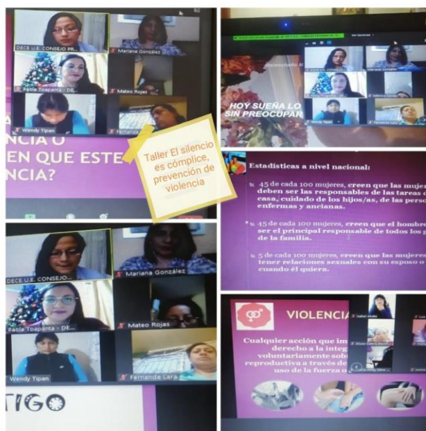
TALLERES CON PADRES DE FAMILIA

La campaña tiene como objetivo reducir los índices de violencia física, psicológica y sexual en las Instituciones Educativas y se ejecuta dentro del marco del Plan Nacional de Convivencia Armónica y Cultura de Paz.