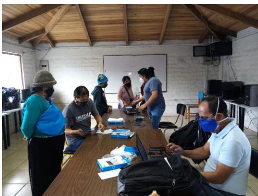
ENTREGA DE TABLETS DONADAS POR LA EMBAJADA DE ESTADOS UNIDOS PARA USO DE ESTUDIANTES DE LA UNIDAD EDUCATIVA INTERCULTURAL BILINGÜE "TRÁNSITO AMAGUAÑA"