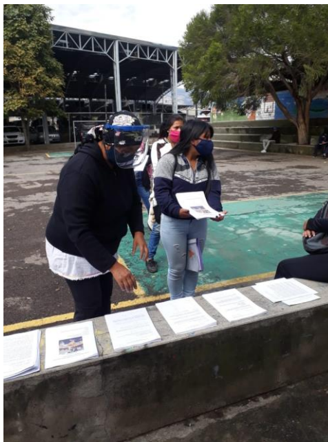
ENTREGA DE GUÍAS PEDAGÓGICA PARA ESTUDIANTES DE LA UNIDAD EDUCATIVA INTERCULTURAL BILINGÜE "TRÁNSITO AMAGUAÑA"

El Sistema de Educación Intercultural Bilingüe (SEIB), de las nacionalidades y pueblos del Ecuador, titulares de derechos individuales y colectivos, comprende desde la Educación Infantil Familiar Comunitaria, hasta el nivel superior.