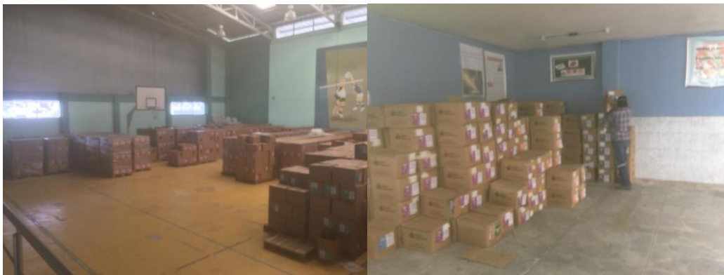
Dotación y correcto almacenamiento de alimentación escolar destinado a estudiantes

En esta de época de pandemia se garantizó la distribución adecuada y oportuna de recursos educativos de calidad con la participación de todos los actores educativos; la meta planteada por el Distrito de Educación 17D06 Eloy Alfaro, se ha cumplido, entregando a los padres de familia, en promedio 1'400.630 raciones alimenticias del Programa de Alimentación Escolar a 77.813 estudiantes beneficiarios, matriculados legalmente en 80 Instituciones Educativas, por cada orden de compra.