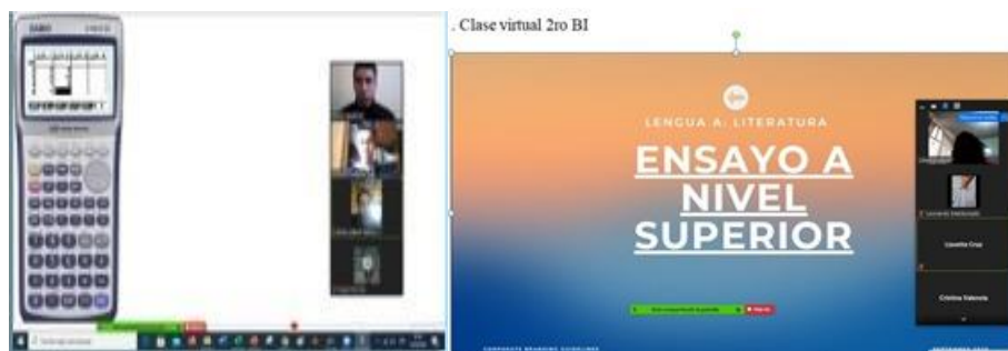
DEMOSTRACIÓN DE CLASES VIRTUALES MEDIANTE EL PLAN APRENDAMOS JUNTOS EN CASA

El Programa del Diploma del BI, es una oferta educativa propuesta para los estudiantes que cursan el Bachillerato en las Unidades Educativas acreditadas como Colegios del Mundo con Bachillerato Internacional (BI), posee altos niveles de exigencia académica e incluye exámenes finales que constituyen una excelente preparación para el ingreso a las Universidades Nacionales e Internacionales y otorgando un certificado avalado Internacionalmente por la Organización de Bachillerato Internacional – OBI,