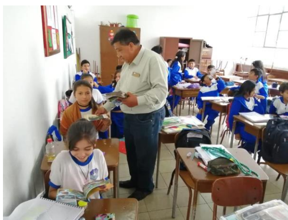
Dotación de textos escolares a estudiantes de todos los niveles educativos