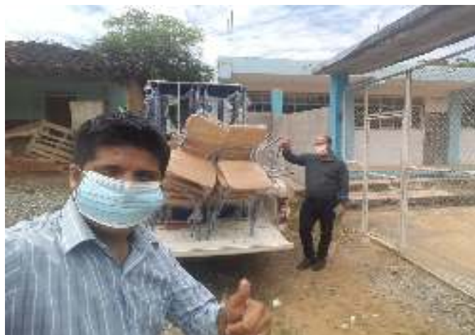
Figura 20. Mobiliario Kit4 entregado en UE Lázaro Cárdenas