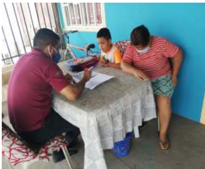
Figura 31. Acompañamiento a estudiantes con NEE asociadas y no asociadas con discapacidad