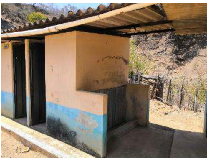
Figura 12. Urinarios colectivos antes de intervención en “Lorenzo de Heredia”