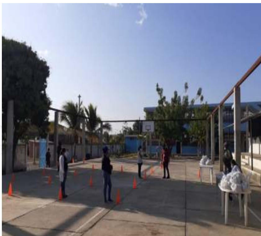
Figura 3. Padres de familia recibiendo Alimentación Escolar EEB “José Antonio Campos”