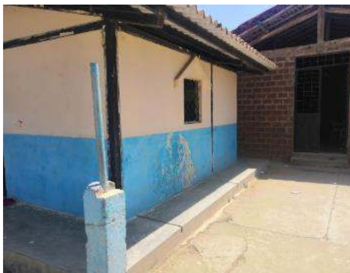
Figura 14. Baterías sanitarias antes de intervención en “María Genoveva Ortíz”