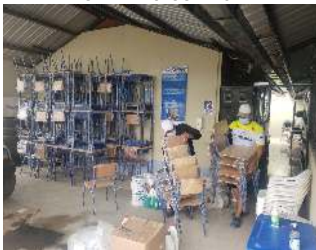
Figura 18. Mobiliario escolar Kit 4