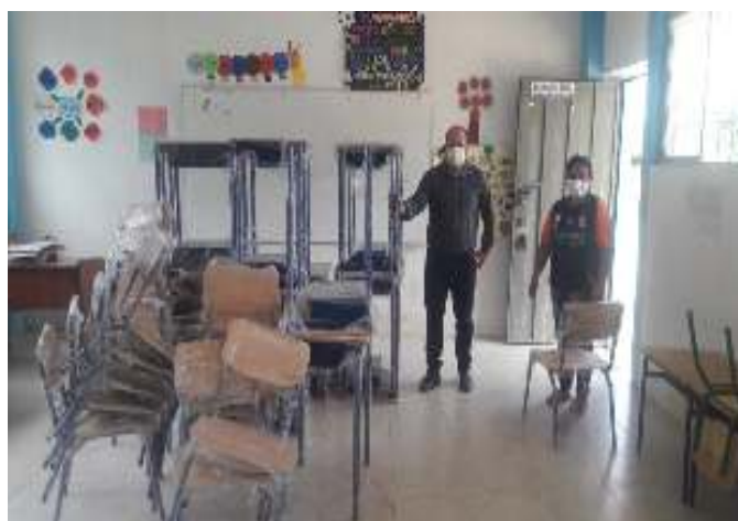
Figura 22. Mobiliario Kit4 entregado en UE Reina Maternal de la Frontera