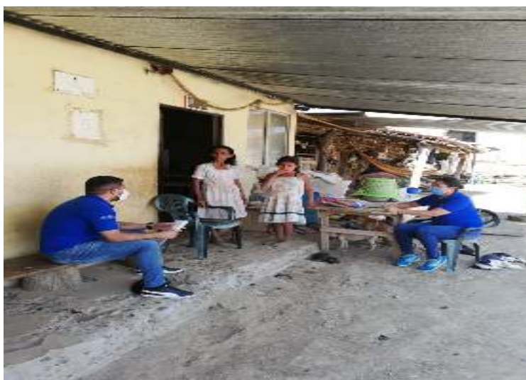
Figura 29. Visita domiciliaria a estudiantes con NEE asociadas y no asociadas con discapacidad