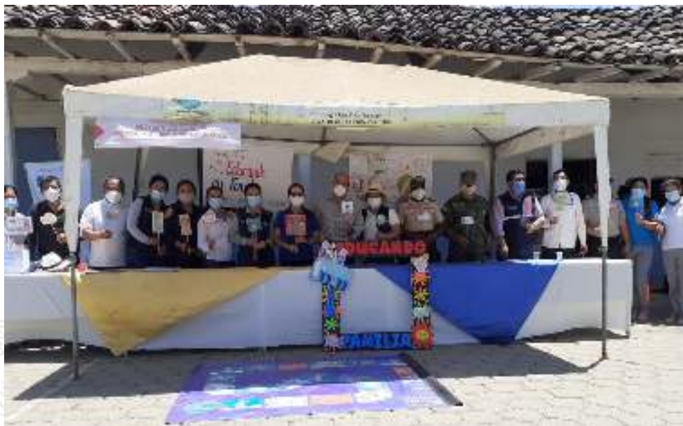
Figura 23. Campaña del Programa “Educaando en Familia”, módulo “Prevención de violencia sexual en familia” propuesta por el MINEDUC, en la misma participaron instituciones involucradas en el cumplimiento de los derechos de niños/as y adolescentes de nuestro cantón