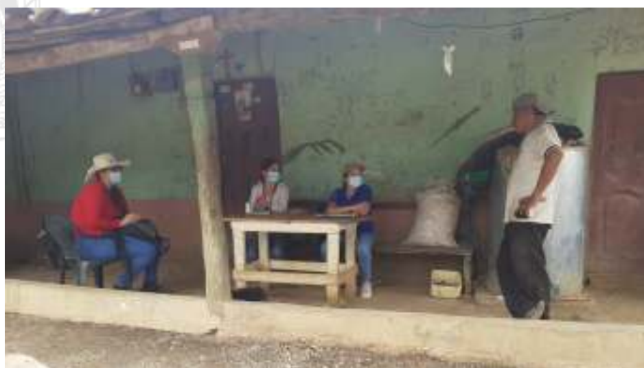
Figura 28. Trabajo en conjunto con miembros de la Junta de Protección de Derechos