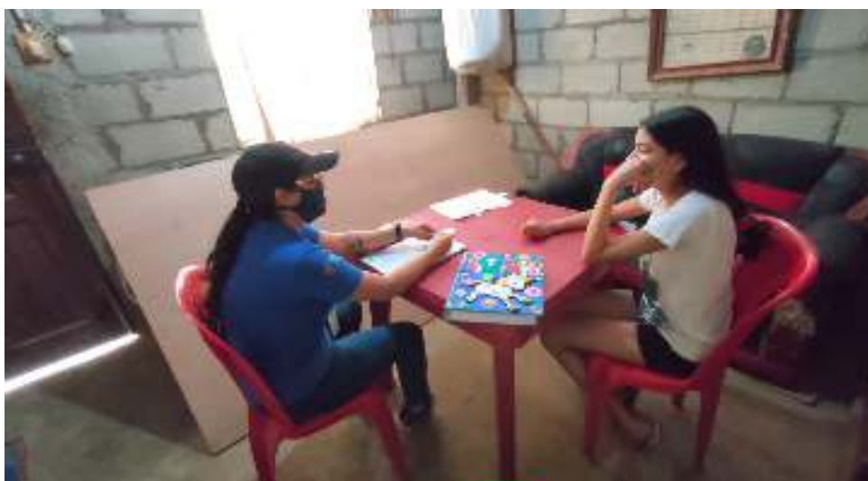
Figura 27. Contención emocional a estudiantes, cuya finalidad fue brindar soluciones y motivar para evitar la deserción escolar