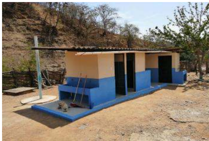
Figura 11. Después de intervención en baterías sanitarias “Lorenzo de Heredia”