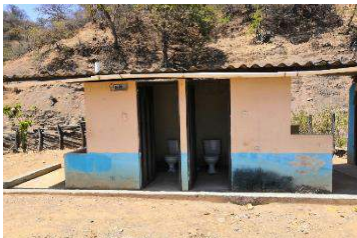
Figura 10. Antes de intervención en baterías sanitarias “Lorenzo de Heredia”