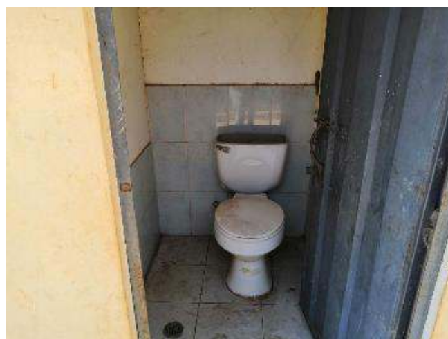
Figura 7. Antes de intervención inodoros en baterías sanitarias Vicente Valdivieso Mora