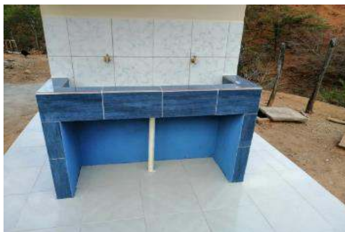
Figura 9. Después de intervención lavamanos en baterías sanitarias Vicente Valdivieso Mora