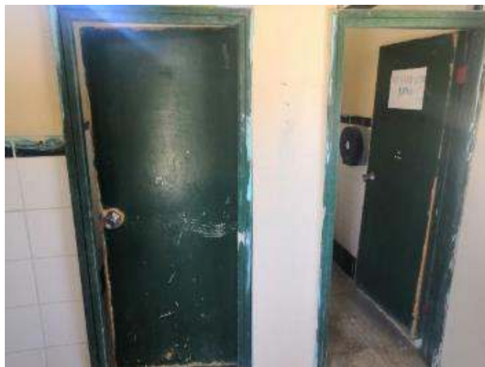
Figura 16. Interior de baterías sanitarias antes de intervención en “María Genoveva Ortíz”