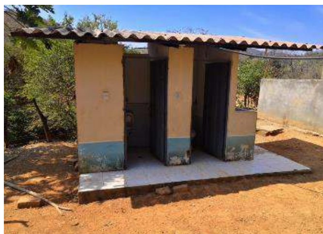
Figura 5. Antes de intervención baterías sanitarias Vicente Valdivieso Mora