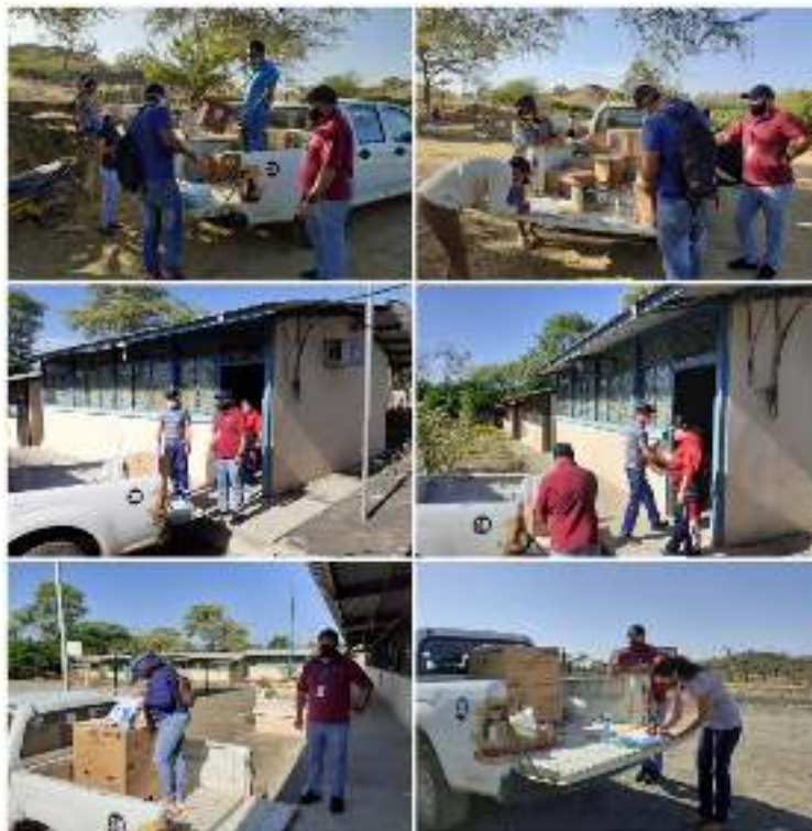
Figura 2. Entrega de textos escolares al circuito