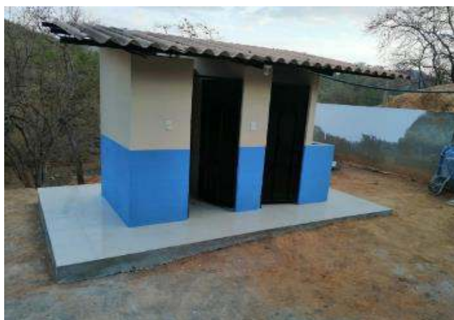
Figura 6. Después de intervención baterías sanitarias Vicente Valdivieso Mora