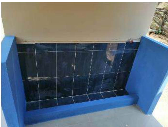
Figura 13. Urinarios colectivos después de intervención en “Lorenzo de Heredia”