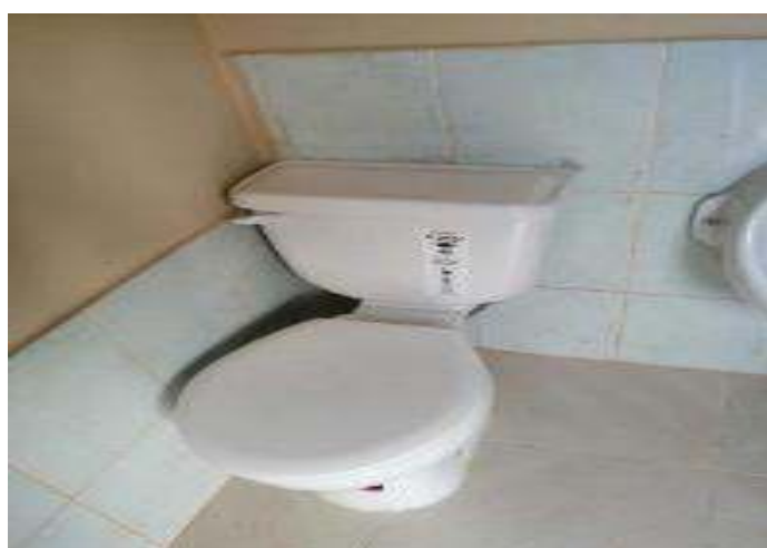
Figura 8. Inodoros después de intervención en Baterías Sanitarias "Vicente Valdivieso Mora