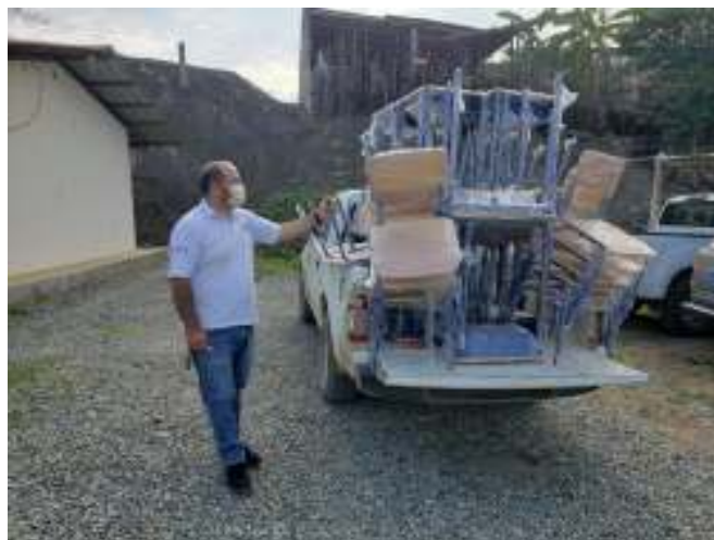
Figura 19. Mobiliario escolar entregado a circuito 11D09C01