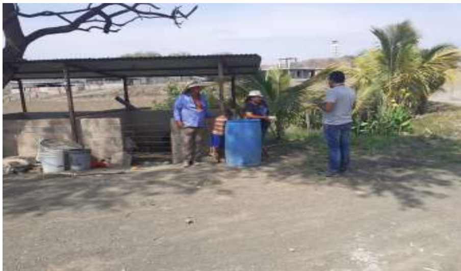
Figura 25. Visitas domiciliarias a familias que presentaron dificultades en el proceso “Juntos aprendemos en casa”, cuya finalidad fue brindar soluciones para evitar la deserción escolar