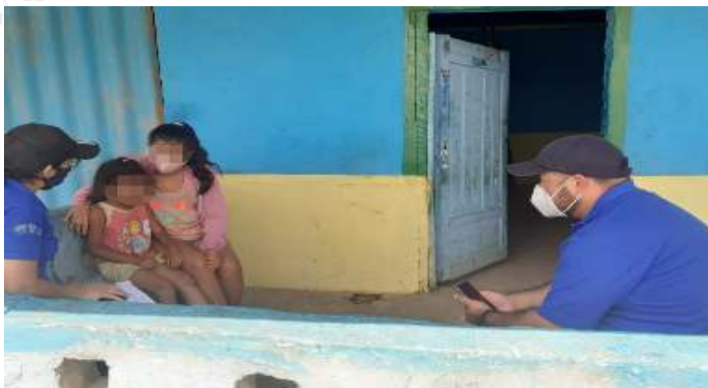
Figura 24. Acompañamiento y seguimiento a estudiantes.