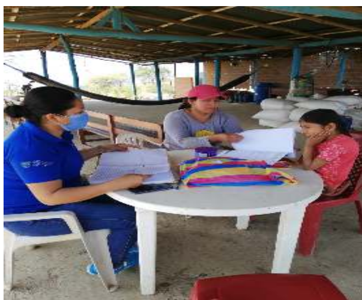
Figura 30. Seguimiento a estudiantes con NEE asociadas y no asociadas con discapacidad