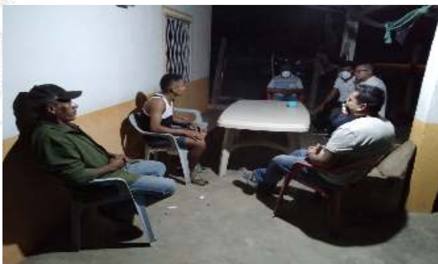
Figura 26. Contención emocional a estudiantes y familiares ante situaciones de duelo. Participan también docentes tutores de la institución