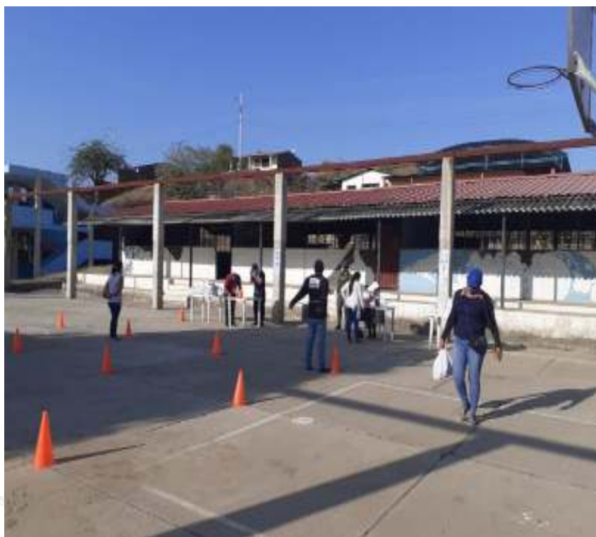
Figura 4. Padres de familia recibiendo Alimentación Escolar Colegio de Bachillerato Zapotillo