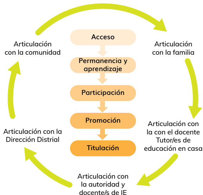
Gráfico 1. Proceso de implementación del servicio de Educación en Casa

Elaborado por: Equipo de la Dirección Nacional de Educación Inicial y Básica, 2020