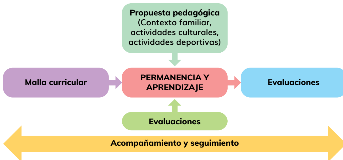
Gráfico 2: Permanencia y aprendizaje