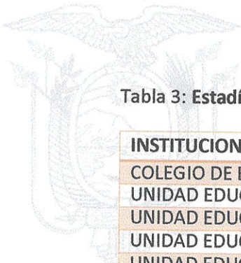
Tabla 3: Estadística Instituciones Educativas Sedes Pruebas Ser Bachiller

Se realizó acompañamiento a 8 estudiantes para bachillerato virtual y obtuvieron título de bachiller en el Colegio Juan Montalvo – Quito