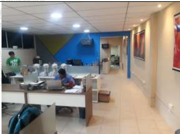
MANTENIMIENTO DEL DISTRITO