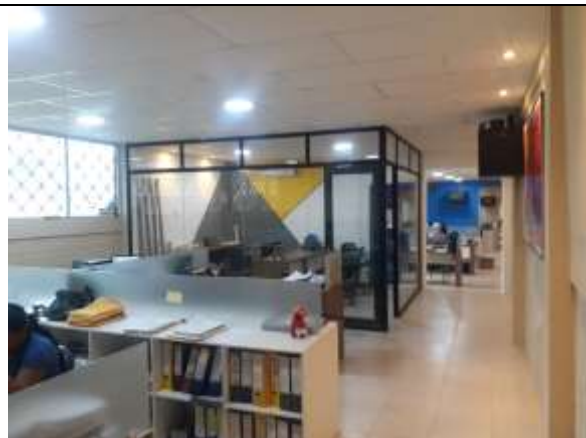
MANTENIMIENTO DEL DISTRITO