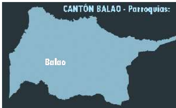
GRÁFICO 3. Mapa Cantón Balao

La Dirección Distrital 09D12 Balao – Naranjal - Educación está conformada por 6 circuitos educativos, integrados por 14 instituciones educativas fiscales en el cantón Balao y 62 en el cantón Naranjal, las cuales se encuentran conformadas de la siguiente forma: