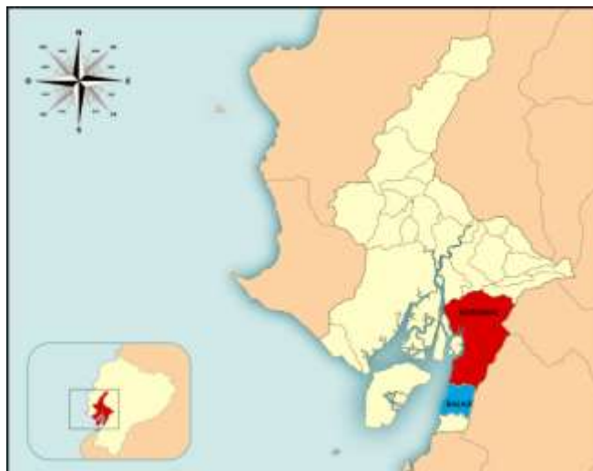
GRÁFICO 1. Ubicación de los cantones Naranjal y Balao

El cantón Naranjal se encuentra formado por las parroquias de: Naranjal (cabecera cantonal), Taura, Jesús María, San Carlos y Santa Rosa de Flandes. Cuenta con una población de aproximadamente 69012 habitantes y alrededor de 20.281 estudiantes asistentes a instituciones fiscales.