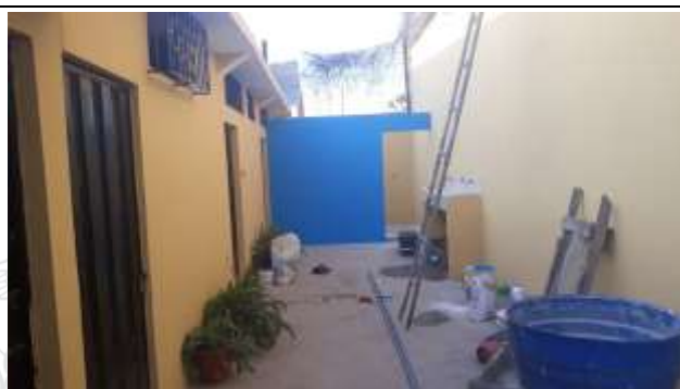
MANTENIMIENTO DE LOS BAÑOS UE DR. JOSE FALCONI VILLAGOMEZ