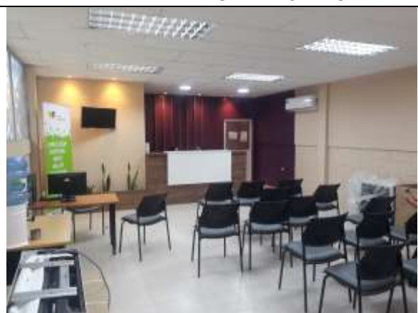
MANTENIMIENTO DEL DISTRITO