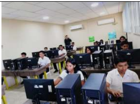
ADECUACIÓN DE LABORATORIO UE BALAO