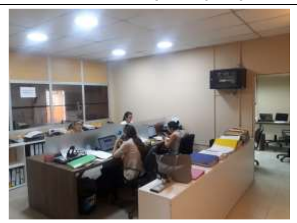
MANTENIMIENTO DEL DISTRITO