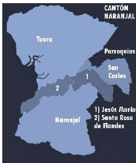
GRÁFICO 2. Mapa Cantón Naranjal

El cantón Balao cuenta con 24 recintos, siendo los principales: San Carlos, La Florida, Cien Familias, Eloy Alfaro, Voluntad de Dios, entre otros. Cuenta con una población de aproximadamente 20.523 habitantes y alrededor de 5.938 estudiantes asistentes a instituciones fiscales.