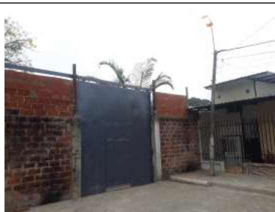
REPARACIÓN DE PORTON UE QUINCE DE OCTUBRE