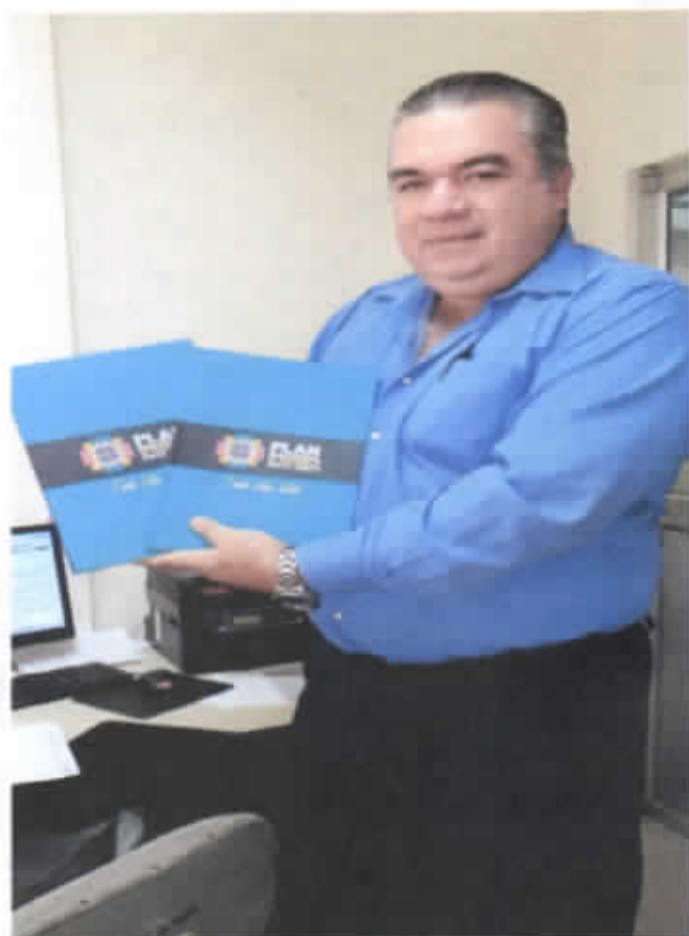
COLEGIO ISMAEL PEREZ PAZMIÑO