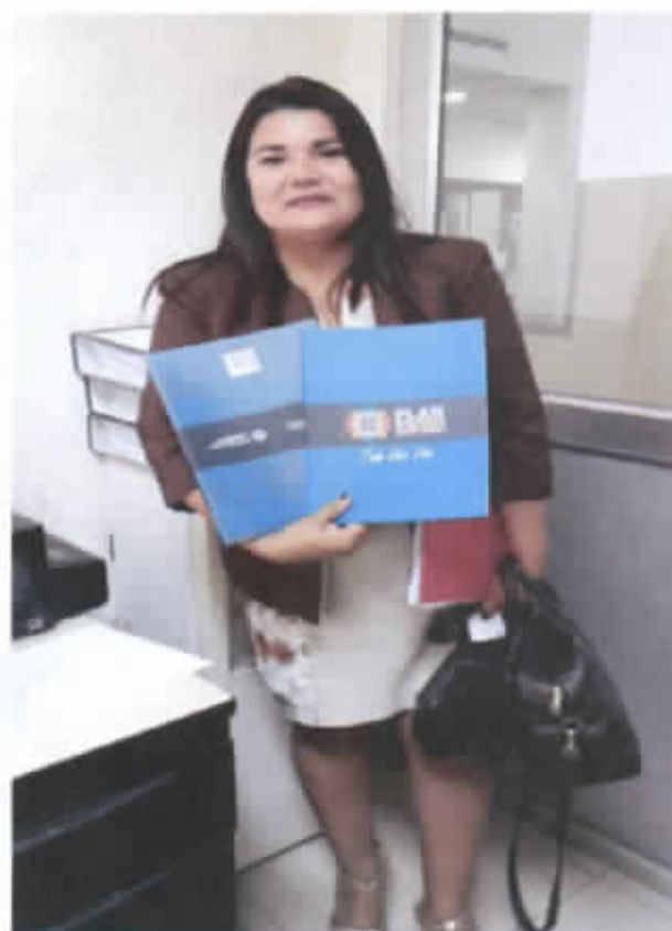
UNIDAD EDUCATIVA "MANUELA CAÑIZAREZ"