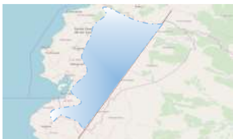
Anexo 1. Definición de troncal amazónica