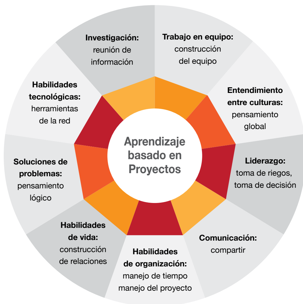
Gráfico 1: habilidades desarrolladas o potenciadas por la aplicación de la metodología basada en proyectos.

Fuente: Hutchings, K. y Standley, M., (2000). Global Project-Based, Learning with Technology, Oregon: Visions Technology in Education.