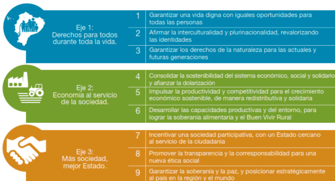
Gráfico 1. Ejes del Plan Nacional de Desarrollo “Toda una vida”

directa con las diferentes problemáticas de política pública que podrían requerir temas de investigación en educación, por lo cual, el taller de alineación de necesidades de investigación, priorizó trabajar con esos dos ejes principalmente.