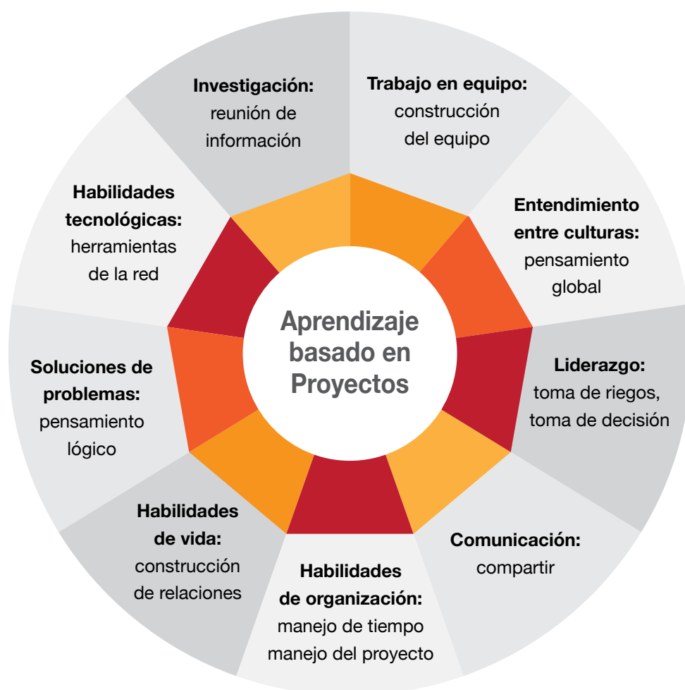
Gráfico 1: habilidades desarrolladas o potenciadas por la aplicación de la metodología basada en proyectos.