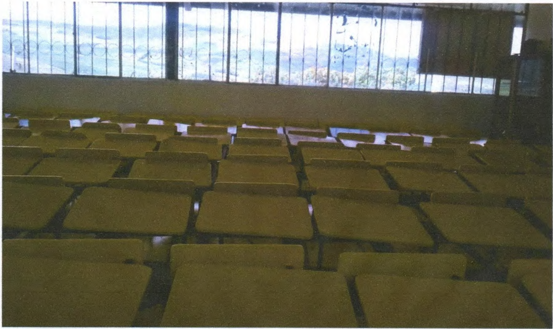
FOTO 6: Capacitación a docentes sobre la utilización de la plataforma Educar-Ecuador.