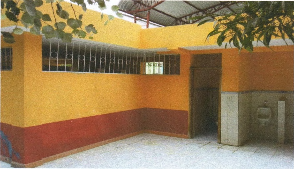
FOTO 4.- Reponenciación (Pintado) de la Unidad Educativa Ciudad de Alausí.