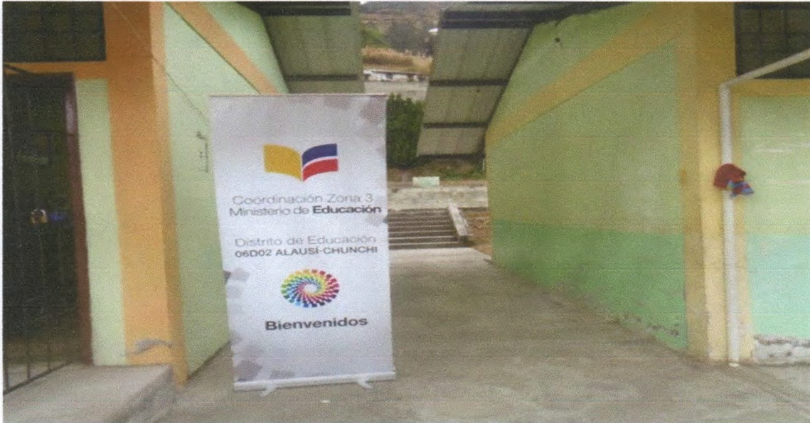
FOTO 7: Plan Decenal Distrital 2016-2025 Desarrollado en la Ex Escuela Polidoro Arellano en el Cantón Alausí, El 13 De Octubre 2015