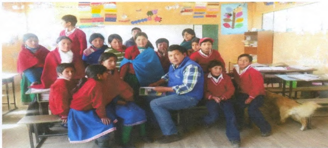
FOTO 8: Visitas a Instituciones Educativas en territorio, de difícil acceso.