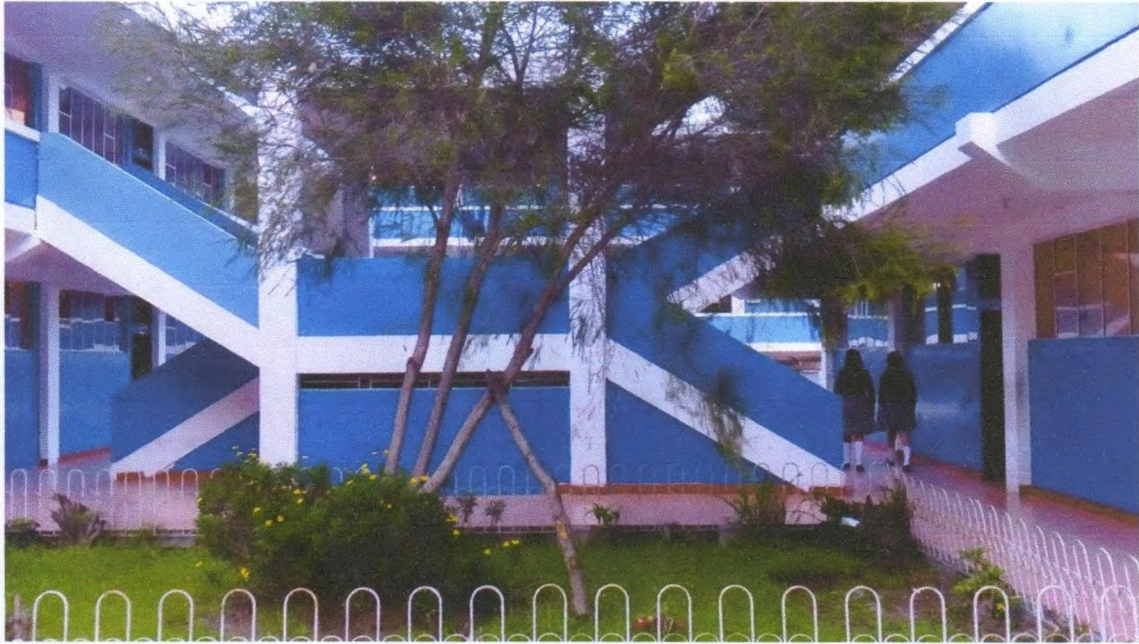
FOTO 5.- Repotenciación de pupitres en las Unidades Educativas de Cocán y Totoras.