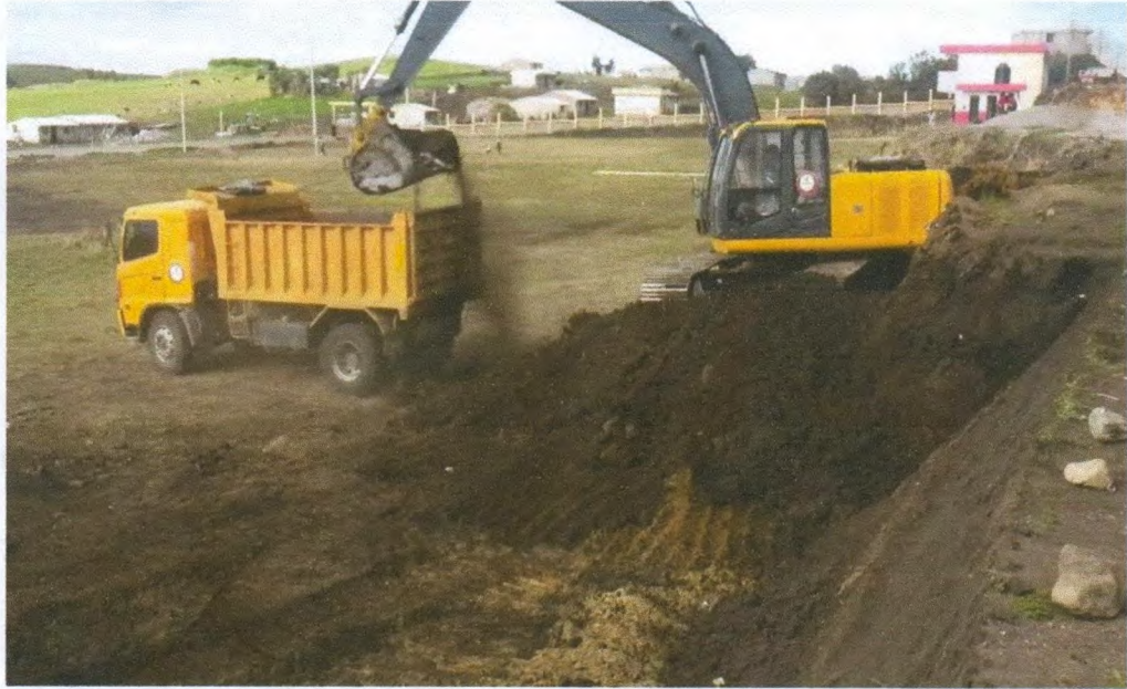
FOTO: Gestión con el Gobierno Autónomo Descentralizado del Cantón Alausí para la Nivelación predio Totoras para la implantación de la Unidad Educativa del siglo XXI.

FOTO 12: Gestión con el Gobierno Autónomo Descentralizado del Cantón Alausí para la Nivelación predio Cocán para la implantación de la Unidad Educativa del siglo XXI.