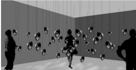
“De Boca en Boca” es una instalación sonora realizada por Edu Comelles.