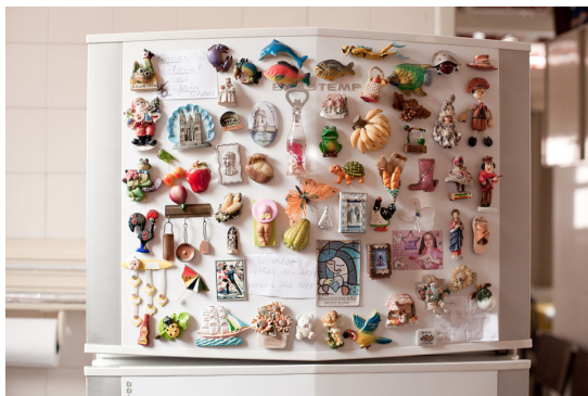
Angélica Dass (Brasil)