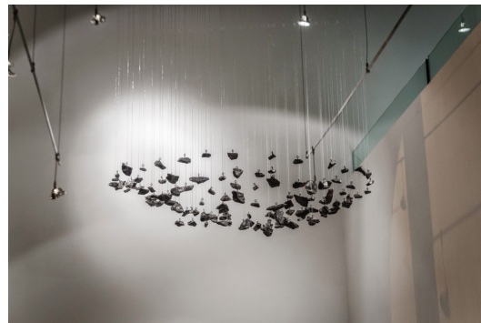
Chai Velasco. Y habían dicho que era un paseo . Instalación, piedras de grafito y nylon, eoporte de acero. 2013.