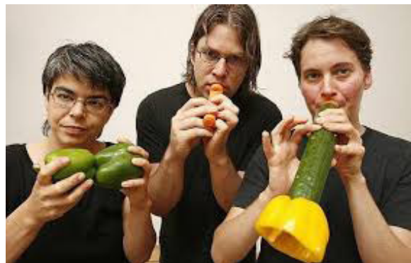
Vegetable Orchestra (Alemania)