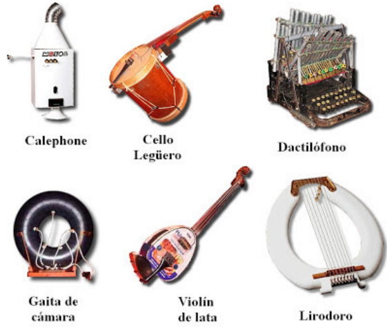
Algunos instrumentos usados por Les Luthiers (Argentina)