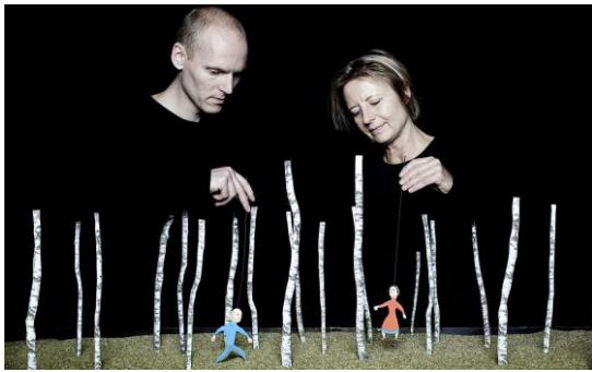
Teatro de objetos. Skabelse , obra de la compañía danesa Theater Refleksion.