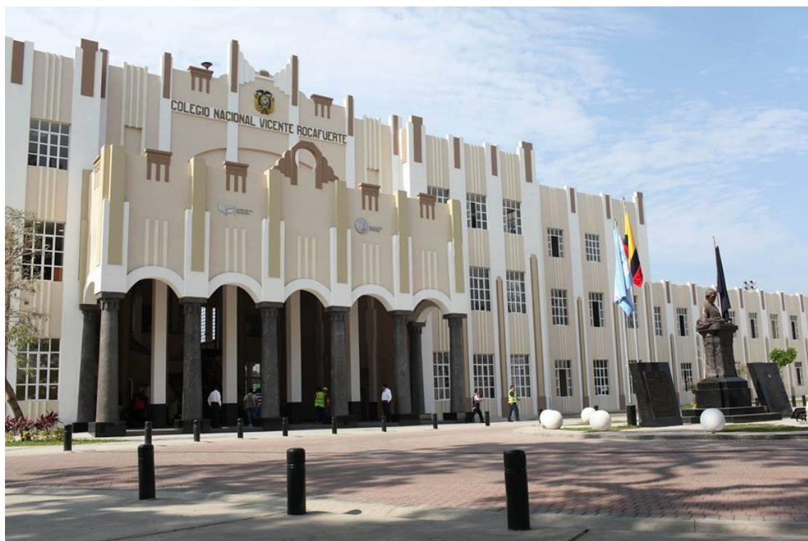
Fachada Frontal de la remodelación Colegio Vicente Rocafuerte