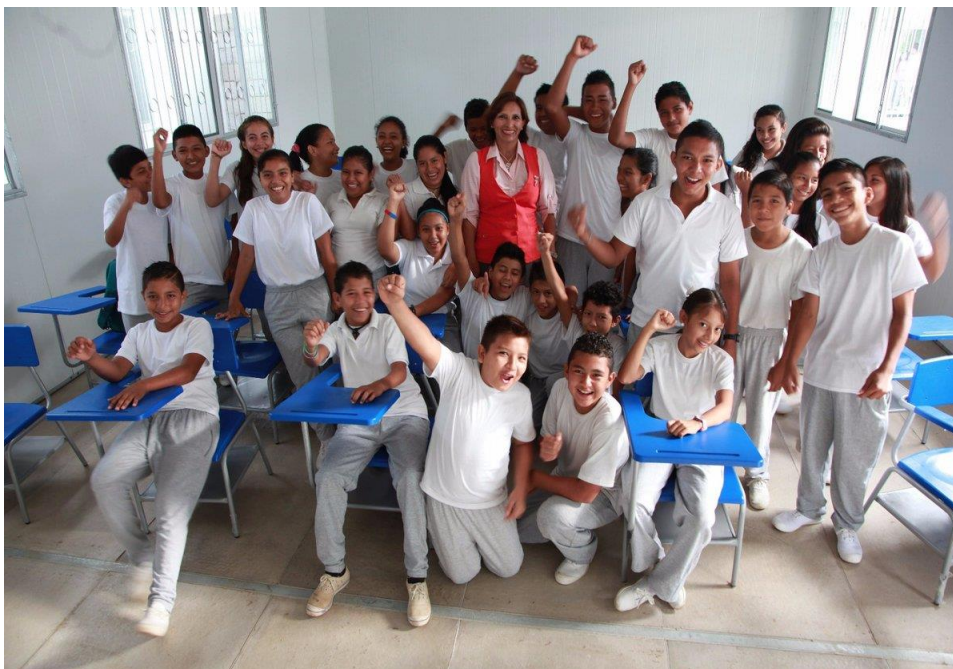
Estudiantes de la Unidad Educativa Tenguel

seguir trabajando en la transformación educativa que vive nuestro país, ¡Transformar la educación, MISIÓN DE TODOS!