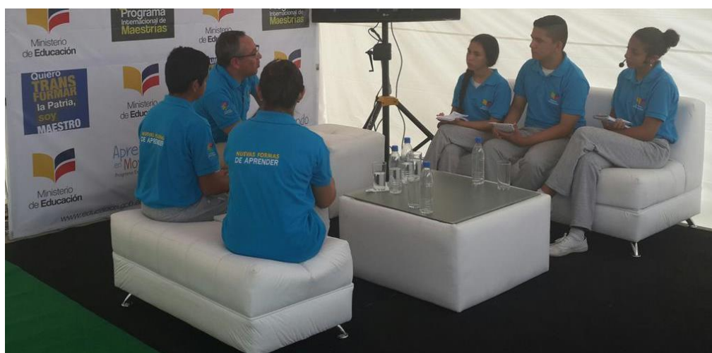
Conversatorio de estudiantes de Actividades Extraescolares con el Ministro Espinosa