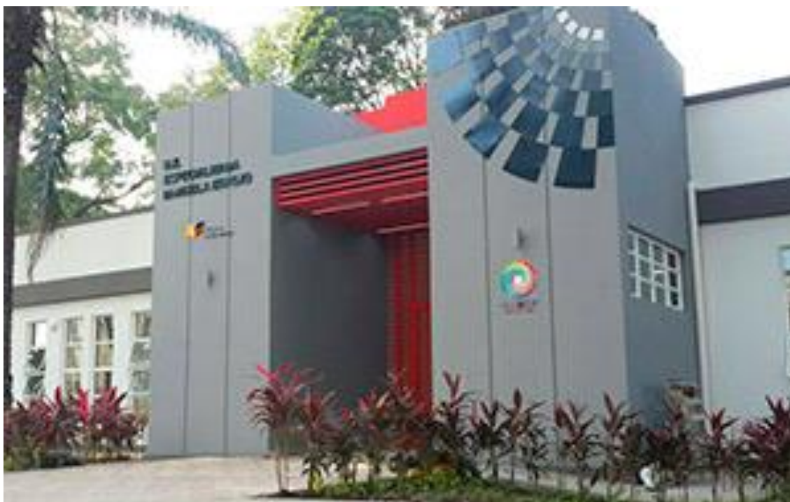
Unidad Educativa Especializada Manuela Espejo