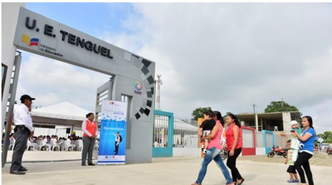
Unidad Educativa Tenguel

Adicionalmente se inauguró la Unidad Educativa Especializada Manuela Espejo y la Unidad Educativa Tenguel.