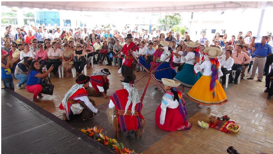
Danza Cultural en celebración del Pawkar Raymi

En el año lectivo 2015-2016 ingresaron 360 nuevos estudiantes con necesidades educativas especiales en las 4 instituciones educativas que ofertan Educación Especializada en la zona, adicionalmente ingresaron 352 nuevos estudiantes con necesidades educativas especiales en instituciones educativas ordinarias.