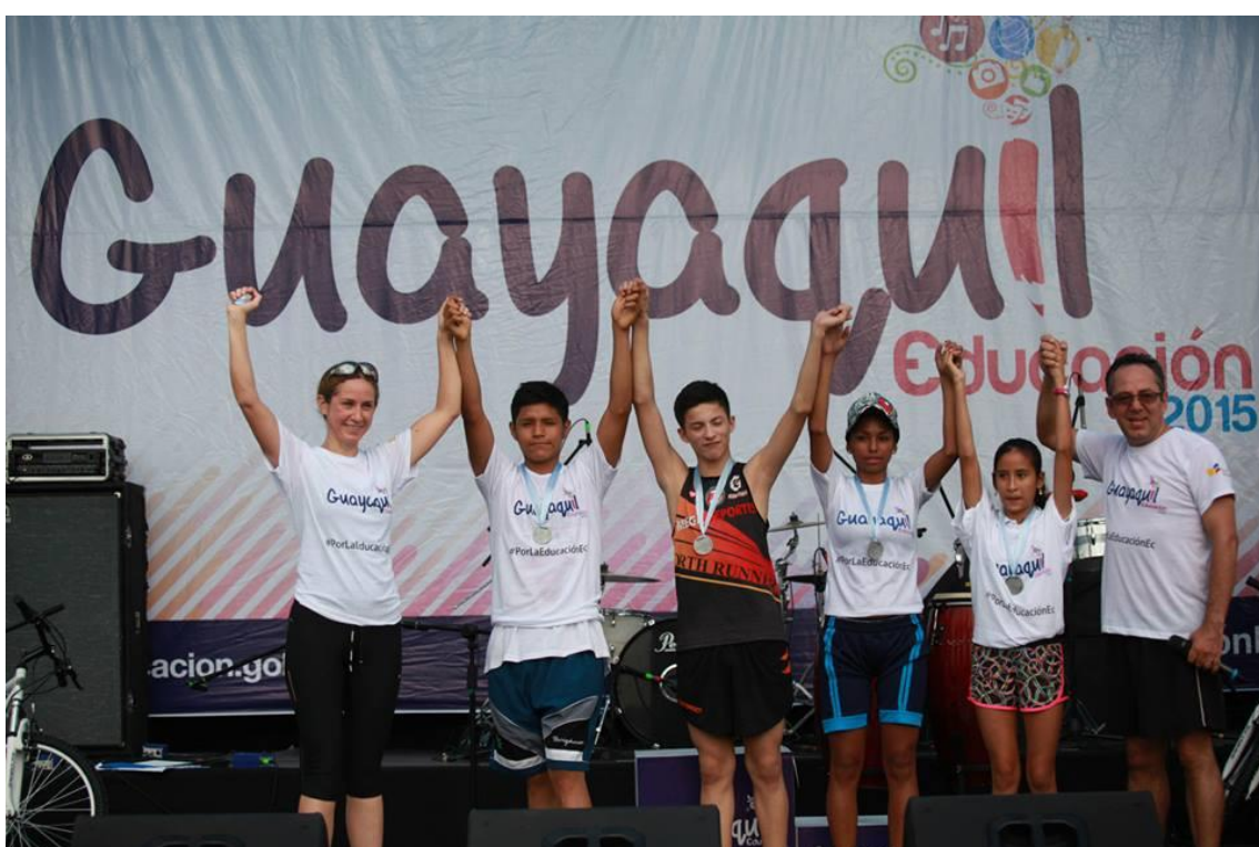
Premiación de Carrera 5k Guayaquil Educación 2015