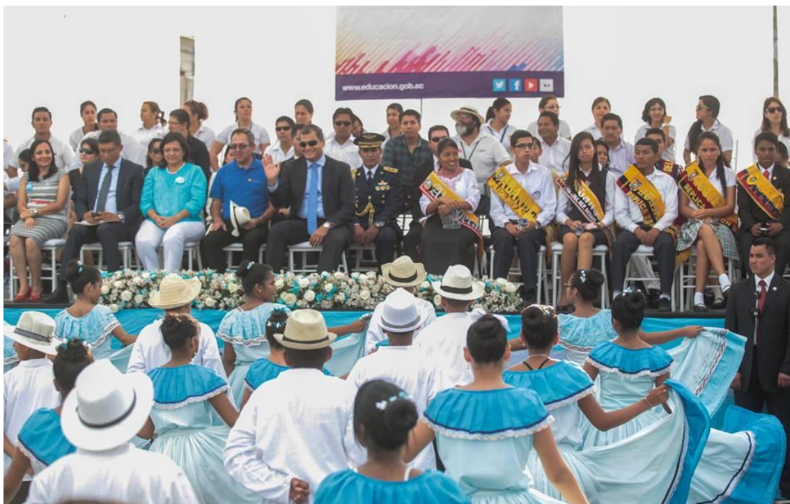
Desfile de actividades extraescolares "Guayaquil a través de la historia"