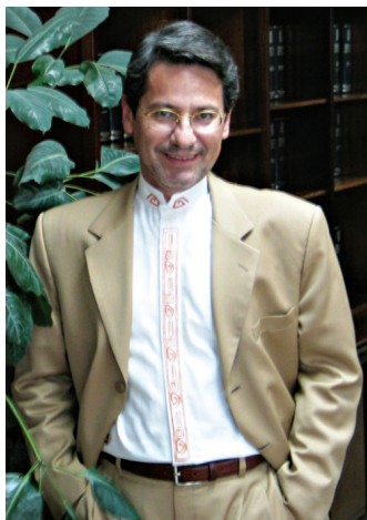
Raúl Vallejo Corral Ministro de Educación Presidente del Consejo Nacional de Educación

esperanza de una vida mejor en las personas. Y es que de eso se trata: como país necesitamos construir un sistema educativo que, en síntesis, sea capaz de ofrecer una educación de la más alta condición académica en América Latina y el mundo y que forme una ciudadanía socialmente responsable, plena de valores éticos y estéticos. Así educamos para tener Patria.