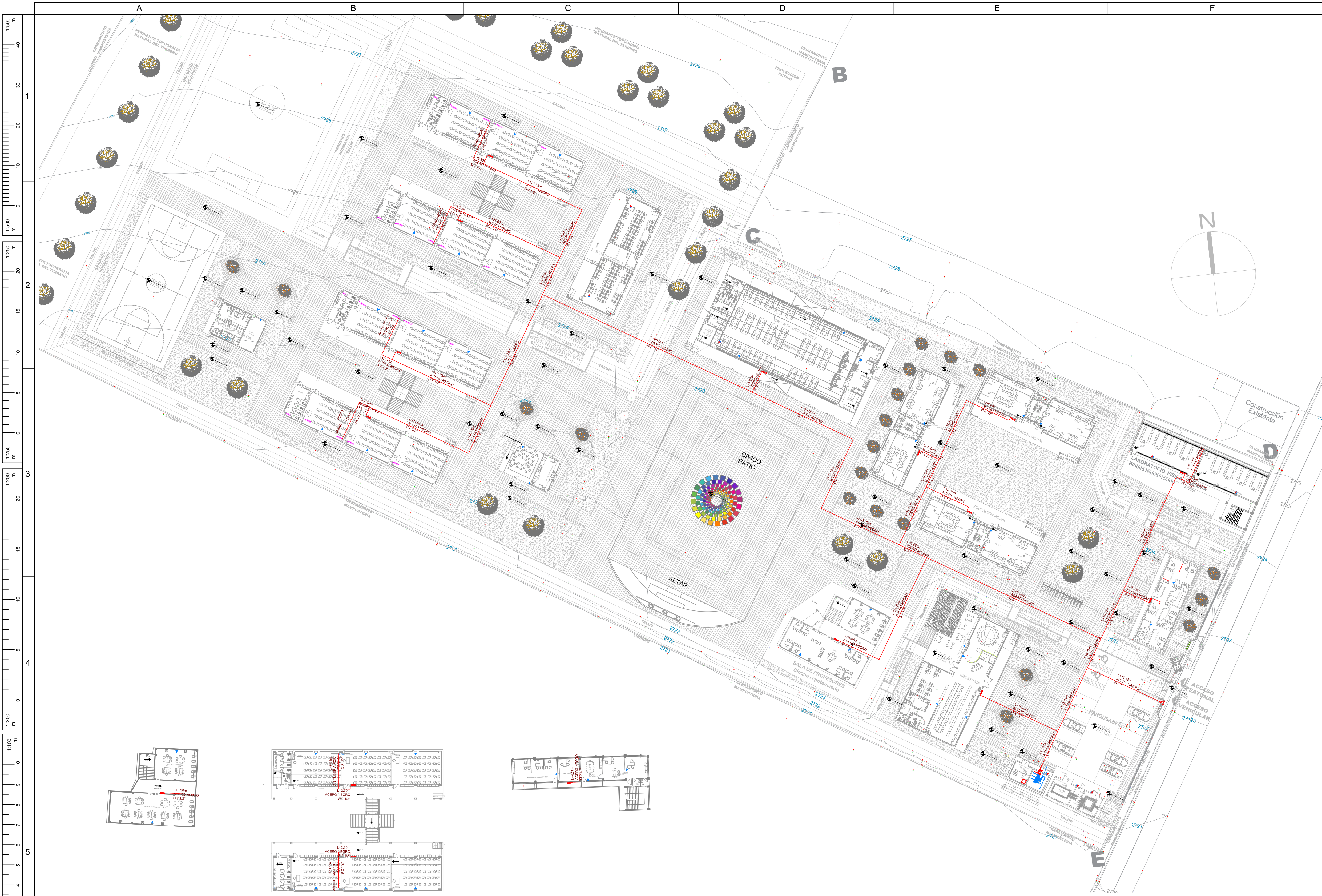
PLANTA ALTA BLOQUE SALA DE PROFESORES