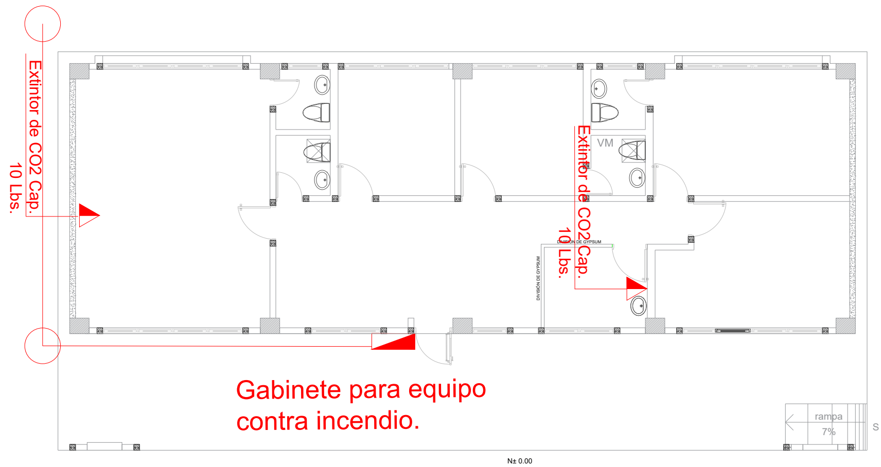
SISTEMA CONTRA INCENDIOS ADMINISTRACIÓN