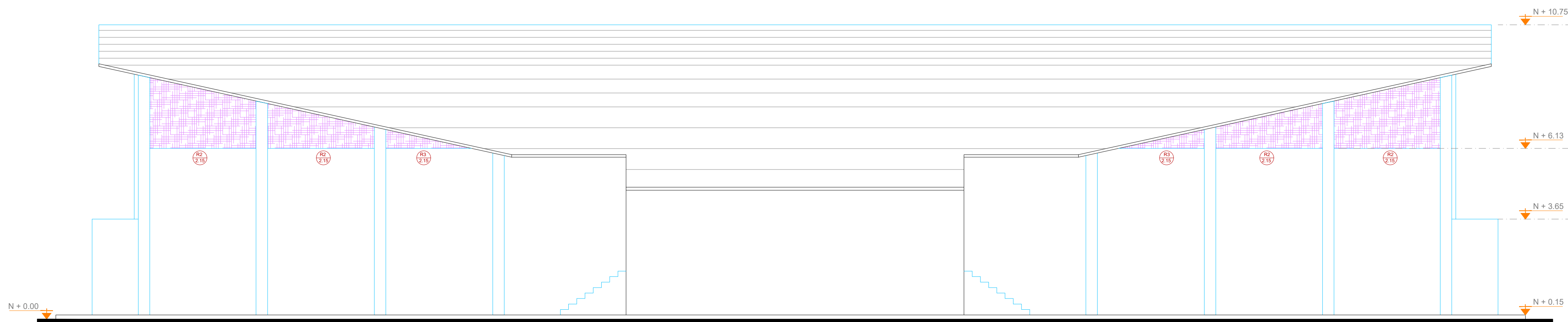
FACHADA POSTERIOR ESC. 1___100