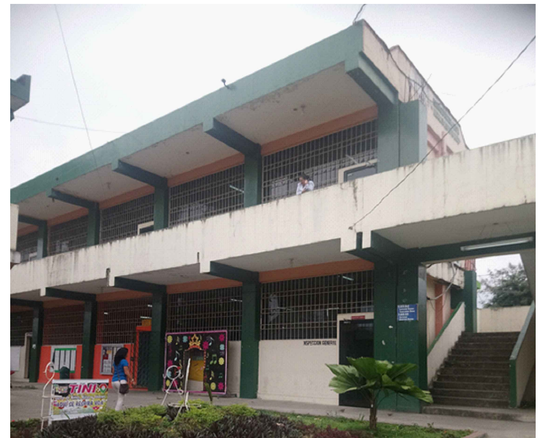
FOTOGRAFÍA ESTADO ACTUAL