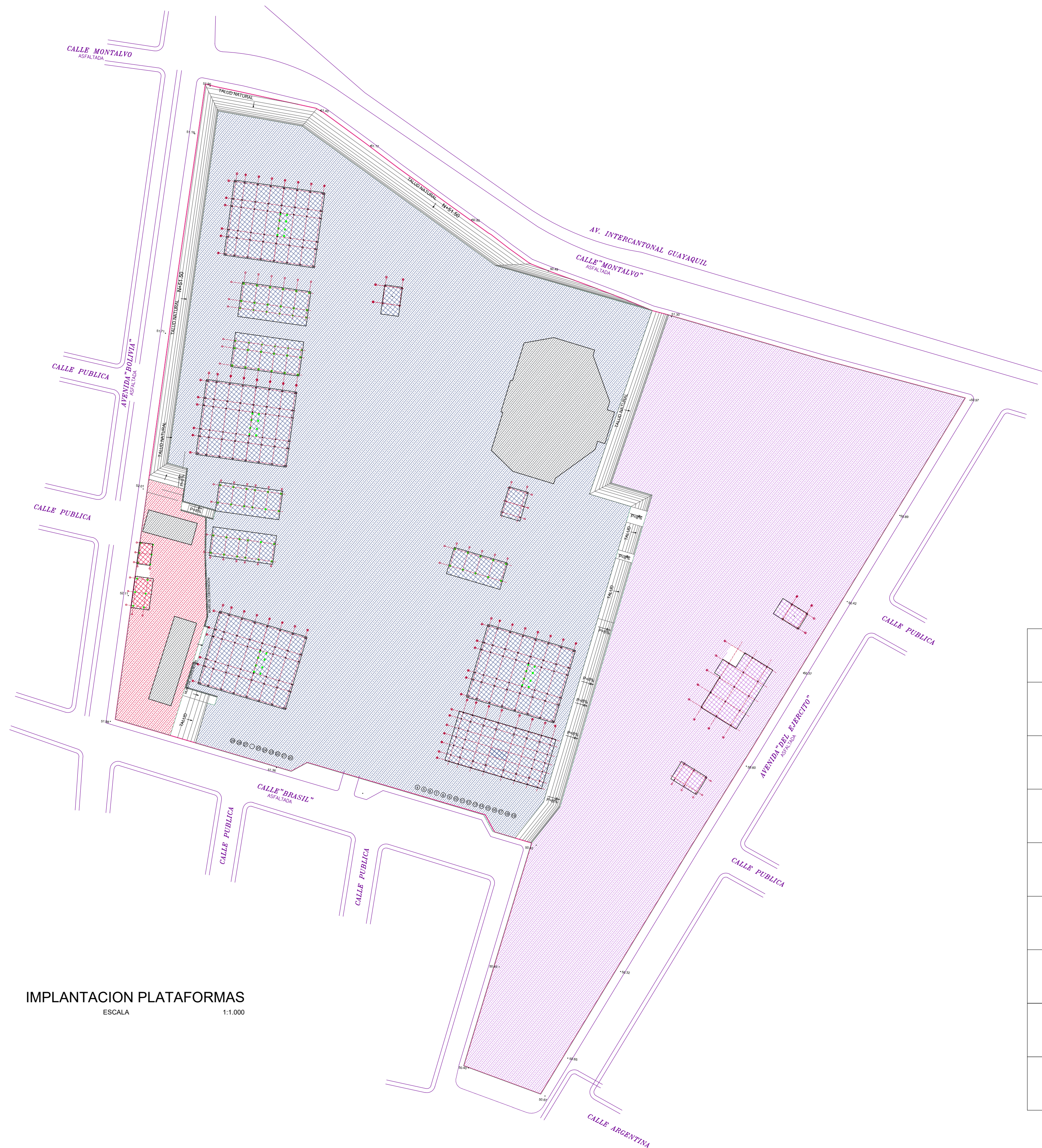
IMPLANTACION PLATAFORMAS ESCALA 1:1.000