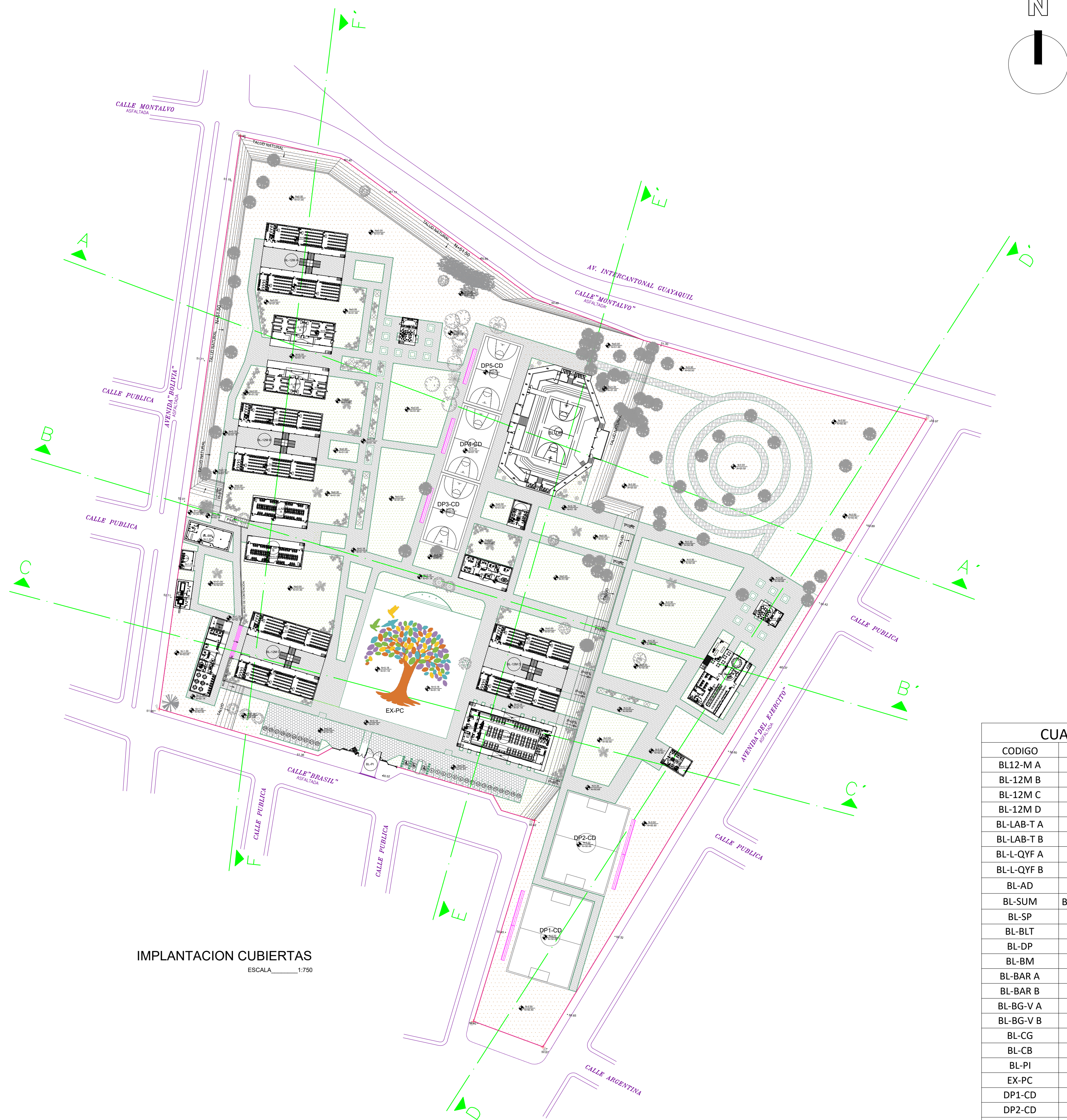
IMPLANTACION CUBIERTAS ESCALA 1:750