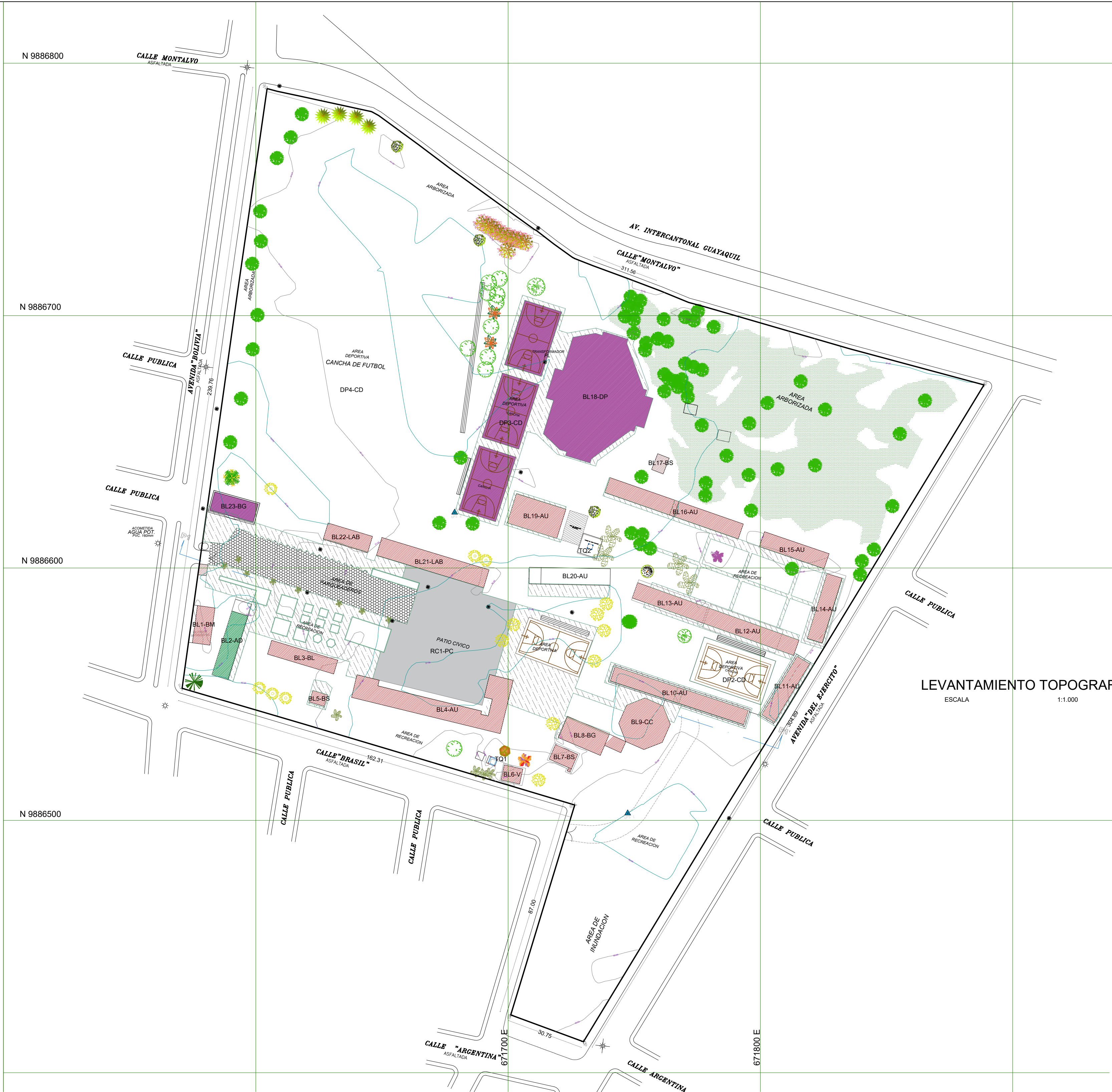
LEVANTAMIENTO TOPOGRAFICO ESCALA 1:1.000