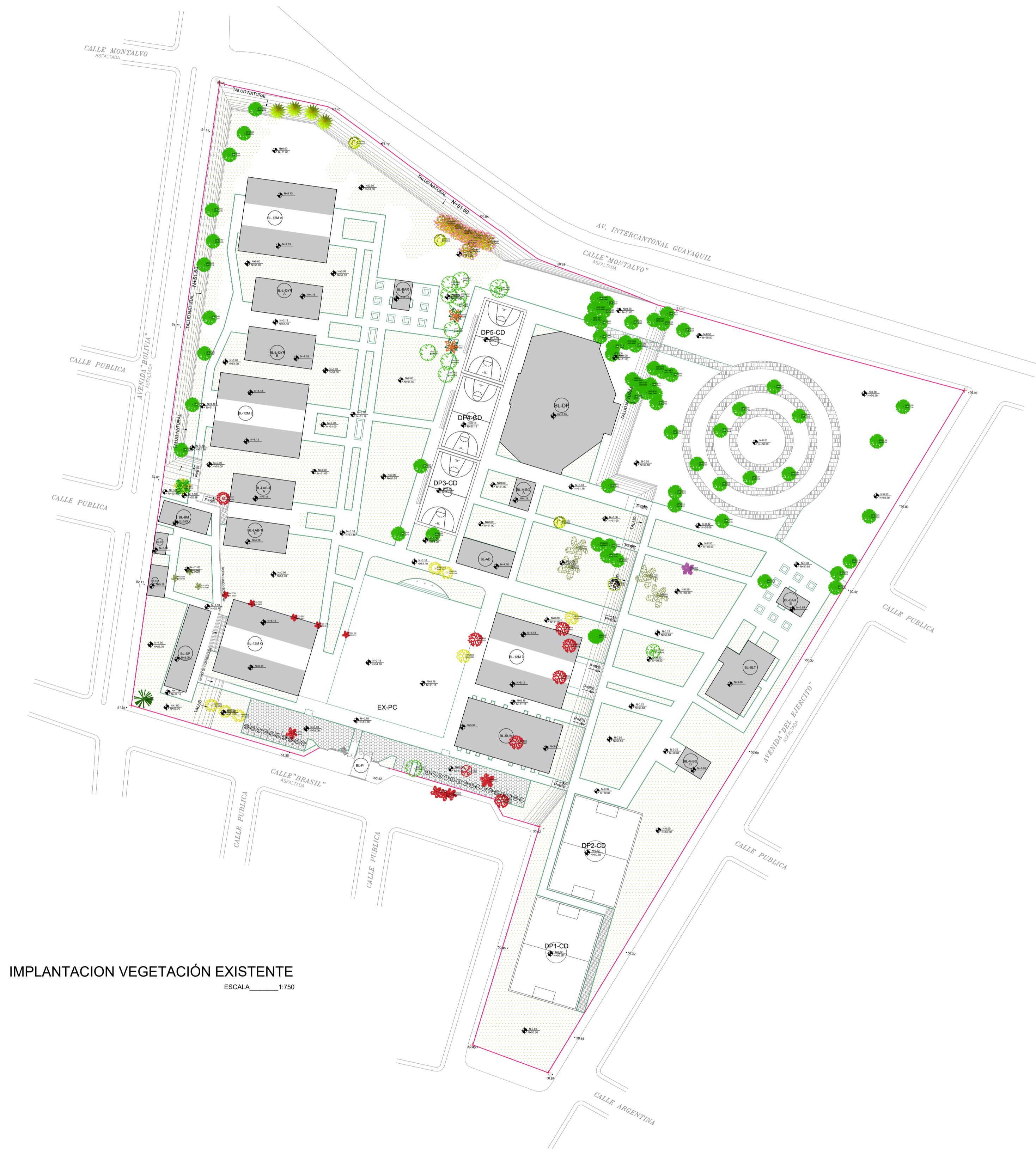
IMPLANTACION VEGETACIÓN EXISTENTE ESCALA 1:750