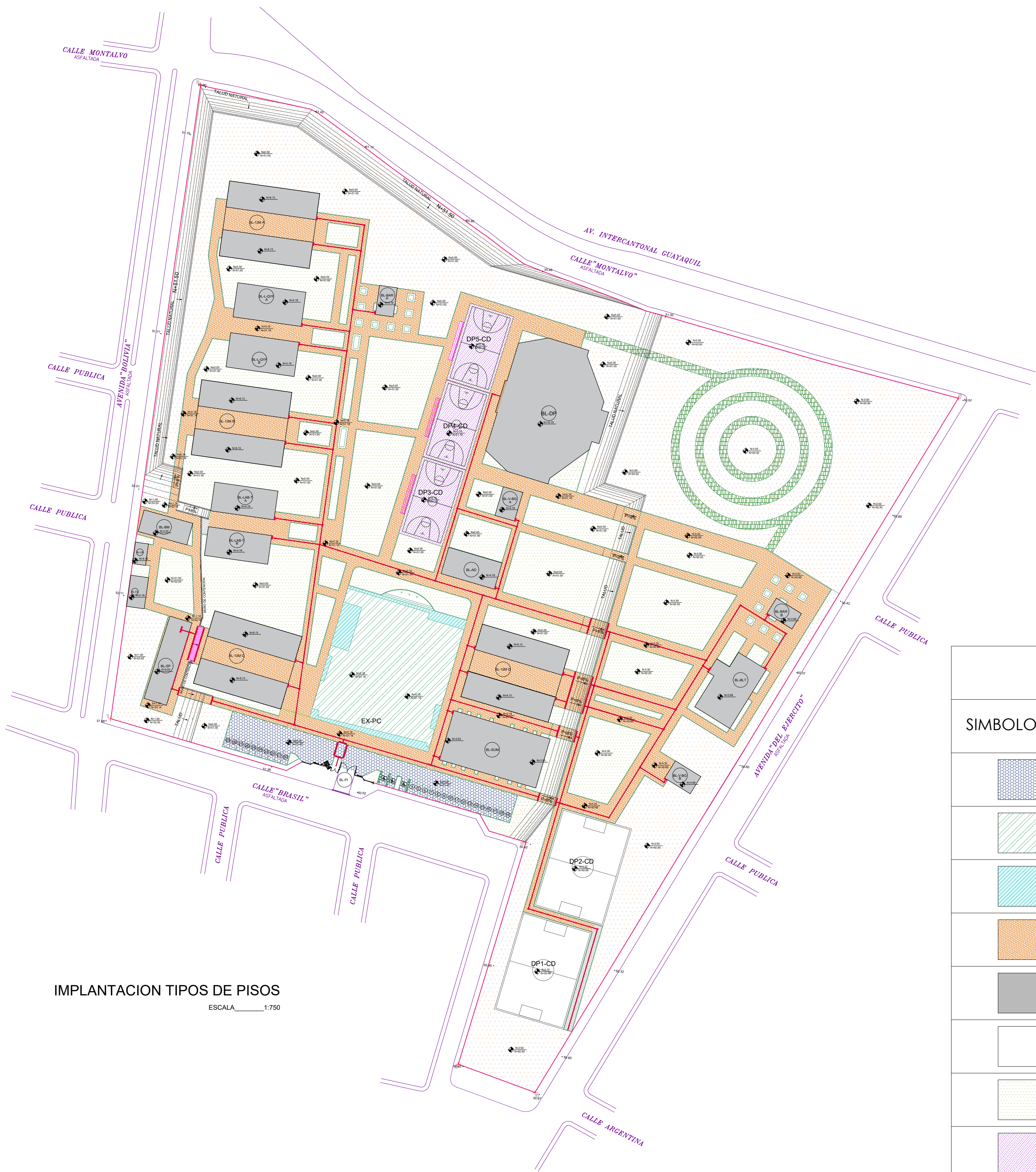
IMPLANTACION TIPOS DE PISOS ESCALA 1:750