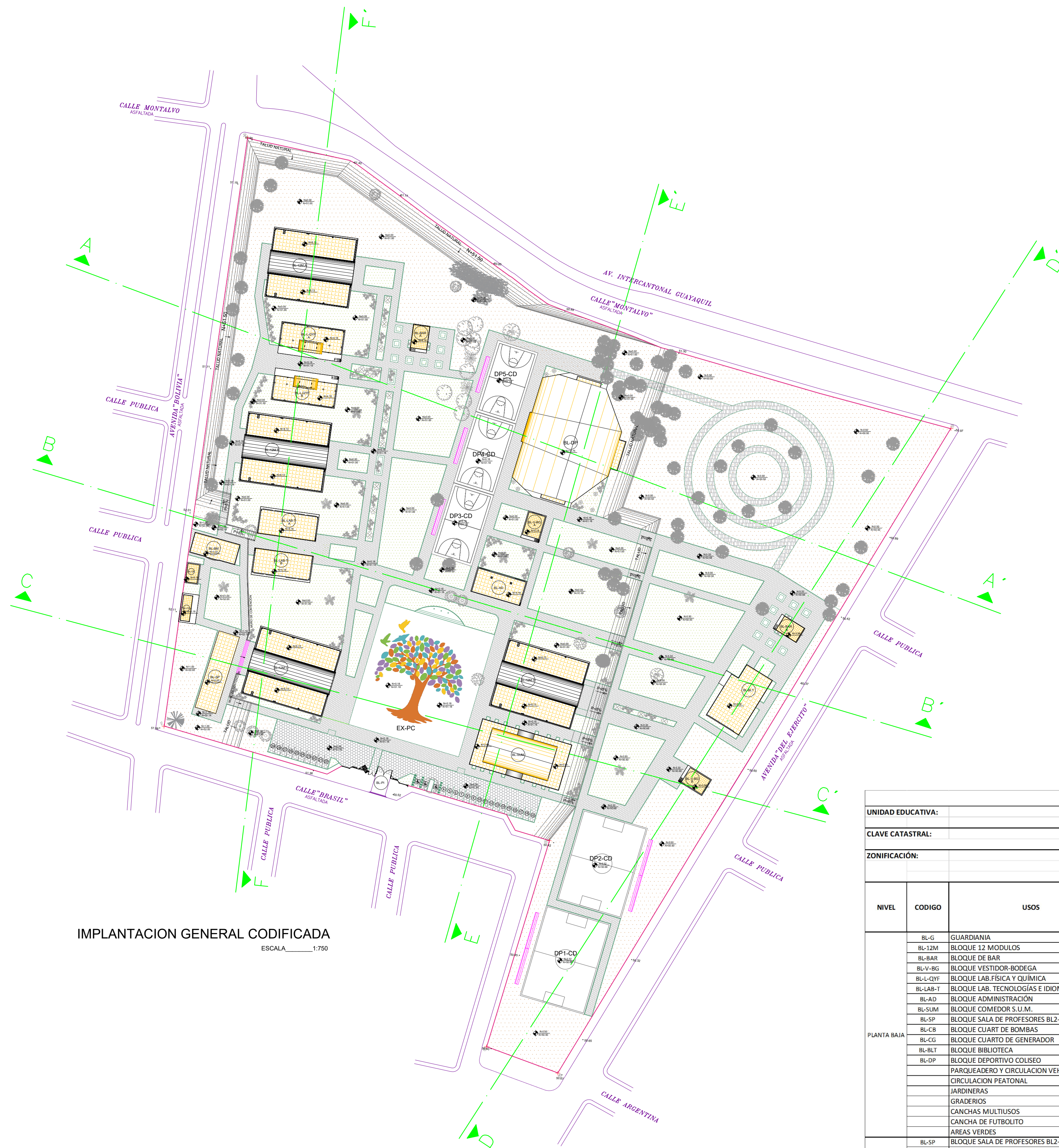
IMPLANTACION GENERAL CODIFICADA ESCALA 1/750