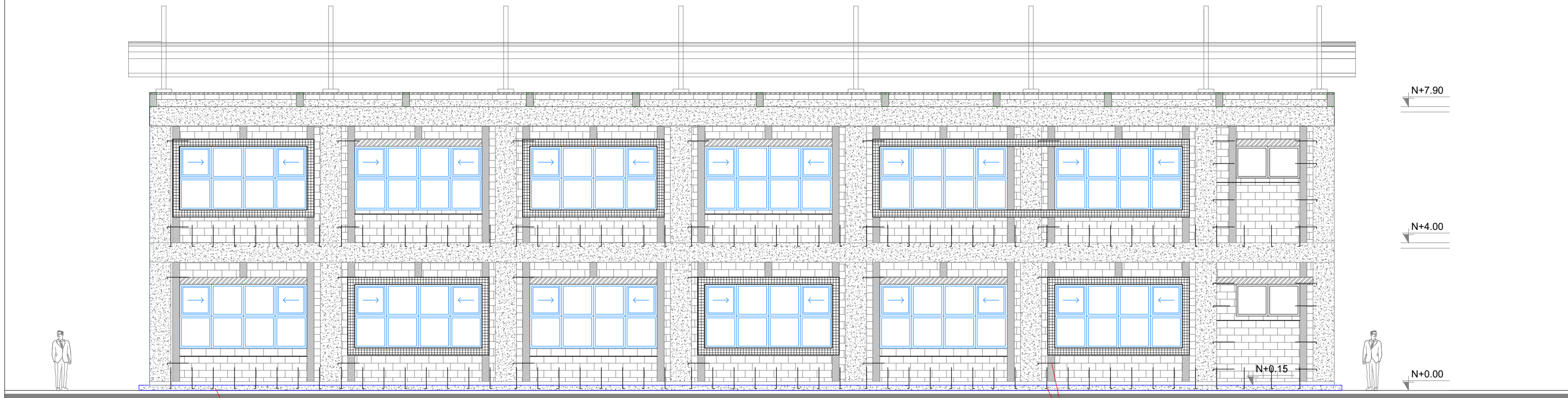
FACHADA FRONTAL ESCALA 1:100