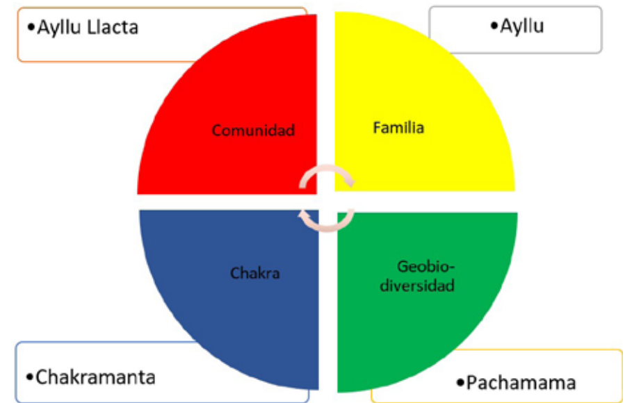
Espacios y Tiempos de la Crianza Sabia

Elaborado por: Cristina Cascante Almeida