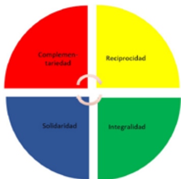
Principios del Kintiku Yachay Elaborado por: Cristina Cascante Almeida