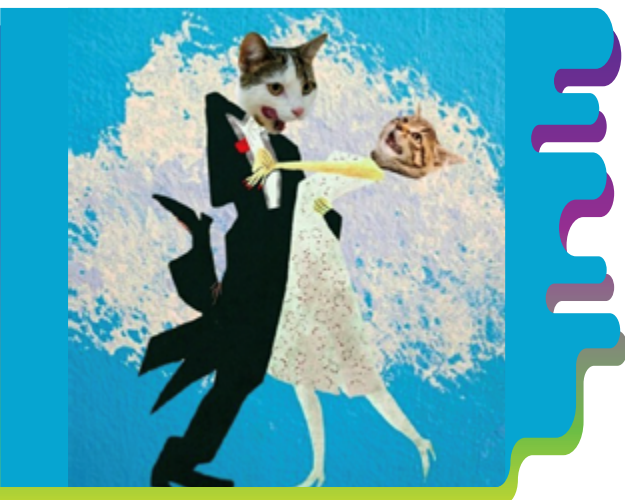
Figura 3. Referente visual para trabajar en clases, técnica collage digital. Ribadeneira (2017).

Hoy en día el juego es tema de simposios y congresos internacionales. En cada ciudad existen centros y talleres de juegos para adultos y para niños; nadie es digno de enseñar ni actuación ni literatura ni química - ¡ni siquiera matemáticas!- si no utiliza técnicas lúdicas y juegos específicos. (p.13)