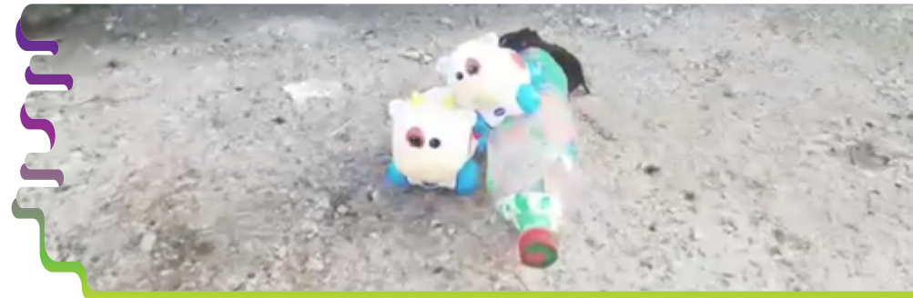
Figura 10. Fotograma del stop motion con juguete realizado por la estudiante y los juguetes de Joel. Encalada (2020).

le contaba que era un chanchito de nombre “Panchito” y que iba a acompañar a sus vaquitas Lola y Sofía (juguetes). Se destaca la capacidad inventiva oral al ir creando una historia del juguete e involucrar elementos de su contexto. Luego, Encalada indica respecto al uso de la aplicación utilizada: “Esto le ayudó a familiarizarse con la tecnología, puesto que él mismo tomó las fotos y entre los dos fuimos colocándolas para hacer la animación”. (G. Encalada, comunicación personal, 15 de agosto de 2020).