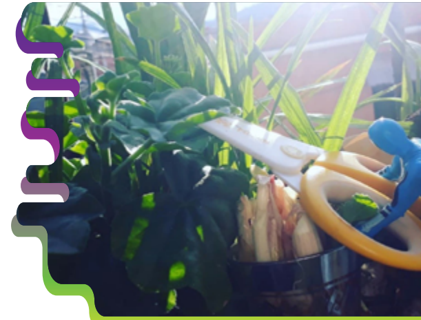
Figura 2. El uso del juguete y la capacidad inventiva. Cusco (2020).

Decidimos que cada estudiante, y recomendamos que hagan lo mismo las docentes de Educación Inicial y Preparatoria, busque un juguete de su infancia o uno que encuentre en casa para que reflexionen acerca de varias ideas revisadas en el encuentro sincrónico, como los paradigmas que se pretenden ajustar en la Educación inicial, por ejemplo, el uso de un juguete u otro si eres niño o niña, el uso del juguete y del juego como recompensa y castigo en el ámbito familiar y escolar; o el considerar que será un mejor juguete por su mayor valor económico. Después, debían socializar en clase los recuerdos de su infancia, las estudiantes reflexionaron acerca de cómo los juguetes que habían disfrutado y con los cuales habían logrado lazos afectivos no tenían que ver con lo económico, muchas veces eran improvisados, o la carga emocional venía porque se los había dado un familiar. La idea era también recrear un escenario que saque de contexto al juguete permitiéndose utilizar la capacidad inventiva que tienen las prácticas artísticas.