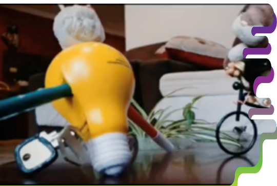
Figura 5. Fotograma del Stop motion con juguete realizado por la estudiante. Mejía (2020).

docente en la misma, sueños personales, la inclusión, etc. Una de esas historias fue la de estudiante Angélica Mejía quien abordó el tema de la inclusión en el contexto escolar. Aquí se conecta la idea del collage con el verse diferentes, y cómo la diversidad finalmente es más bien una oportunidad para convivir con nuestras diferencias. A continuación, una parte de la historia desarrollada por la estudiante Angélica Mejía (2020):