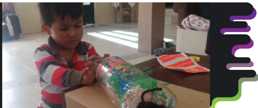
Figura 9. Proceso previo a la toma de fotos para la elaboración de la animación. Encalada (2020).

Las familias, docentes y estudiantes hemos adaptado nuestro proceso de enseñanza-aprendizaje en respuesta a la adversidad que estamos viviendo. Las expresiones artísticas son una vía para comunicarnos, pero, sobre todo para configurar nuevos modos de hacer, esa capacidad inventiva que como docentes podemos potenciar en la educación inicial es la que puede aportar a que en situaciones como esta con y a través de las artes nos volvamos resilientes. Adaptarnos a los cambios implica que busquemos alternativas, por ello el arte resulta necesario porque amplía la perspectiva, nos permite reinventarnos. Resulta primordial resaltar que el arte no se trata de un entretenimiento o de utilizarlo para llenar el tiempo del niño y de la niña ni se limita sólo a una vía de expresión, que no es nada menor. El arte nos vuelve seres críticos, empáticos a nuestro entorno y capaces de diseñar otras formas de vivir.