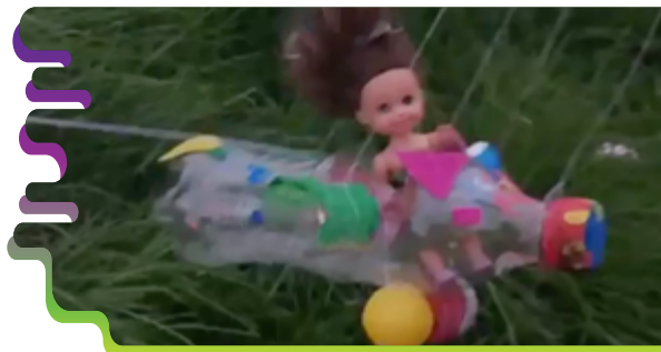
Figura 6. Fotograma del Stop motion con juguete realizado por la estudiante. Encalada (2020).

En esta otra imagen, se observa el trabajo de la estudiante Gabriela Encalada donde el juguete que elaboró “vuela” animado por la técnica del stop motion .