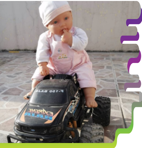
Figura 1. El juguete como evocación de la memoria. Vázquez (2020).

Cuando hablamos de educación inicial y el arte diferenciamos entre recaudar actividades de clases para niños y niñas, y experimentar esas actividades siendo docentes-adultos. Las expresiones artísticas ya tienen su recorrido en las dinámicas que ha sistematizado la educación inicial en sus currículos institucionales, tales como el dibujo, la pintura, la danza o en el uso de ambientes o rincones “artísticos” donde interactúan los niños y niñas para desarrollar su expresión, comunicación, motricidad, y donde el docente puede reflexionar sobre su propia práctica. Se decidió con la clase explorar expresiones, técnicas o materialidades del arte a través de las orientaciones metodológicas que el Currículo de Educación Inicial (2014) de Ecuador, señala respecto a: