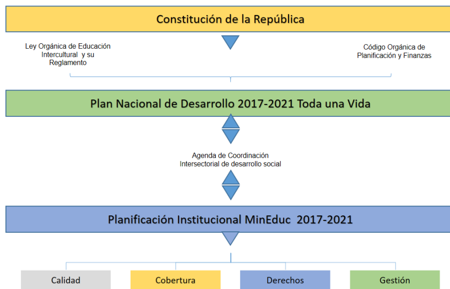
Imagen: Articulación de la planificación del Ministerio de Educación con los instrumentos de política nacional e intersectorial

Es así como, la planificación del Ministerio de Educación responde a los siguientes instrumentos de política nacional e intersectorial.