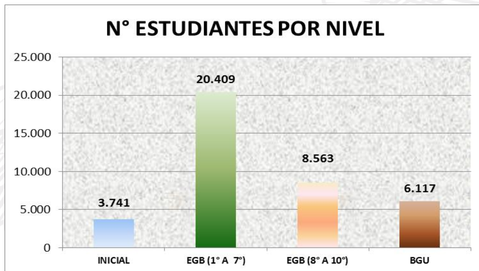
Gráfico N° 2: Cobertura de estudiantes por nivel

Elaborado por: Unidad Distrital de Planificación 17D02