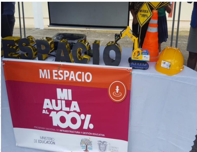
MI AULA AL 100%