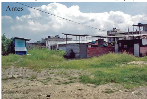
Escuela “República de El Salvador” Guayaquil, GUAYAS