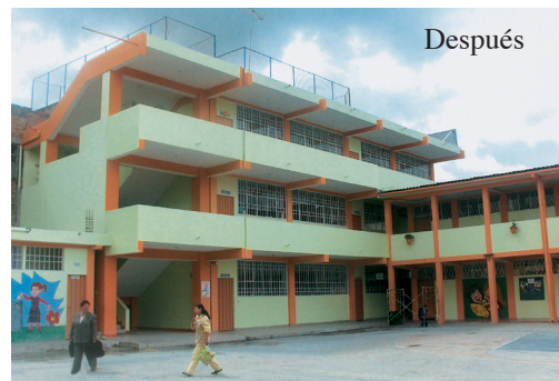
Escuela “Ignacio Martínez” San Pedro, TUNGURAHUA