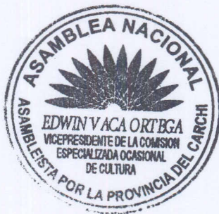
EDWIN VACA ORTEGA ASAMBLEÍSTA POR LA PROVINCIA DEL CARCHI