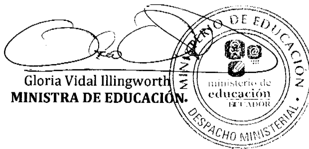
Gloria Vidal Illingworth MINISTRA DE EDUCACIÓN.