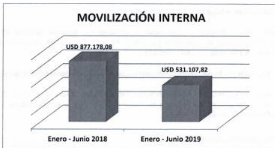
Fuente: Sistema de Administración Financiera e-SIGEF- Viáticos al interior 30 de junio de 2019

Se ha priorizado el uso de las herramientas informáticas (Equipos de Videoconferencia), en los casos que permitan cubrir las necesidades institucionales para llevar adelante reuniones de trabajo, de igual manera los viajes dentro de territorio son autorizados por la Máxima Autoridad de Ministerio del Ministerio de Educación o sus delegados, lo que ha resultado en la reducción del 39% conforme se muestra en el gráfico a continuación: