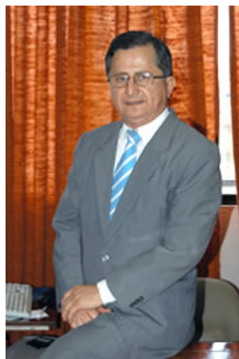
Para ampliar de Clic en la foto