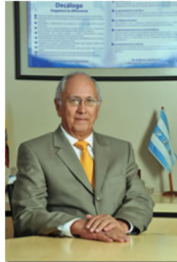
Para ampliar de Clic en la foto