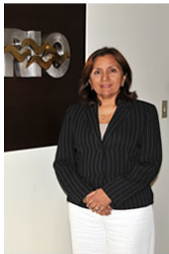
Para ampliar de Clic en la foto