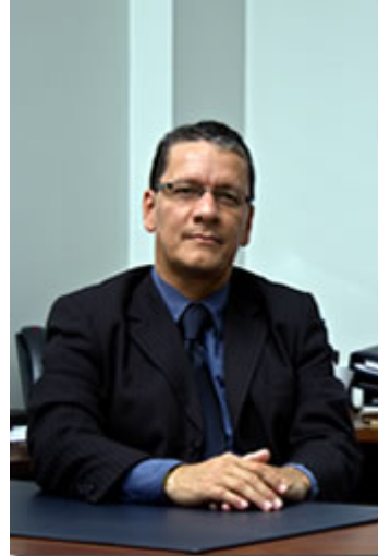
Para ampliar de Clic en la foto