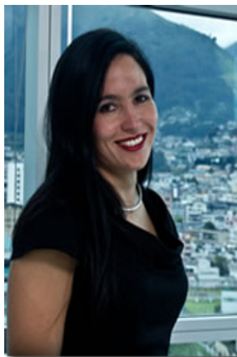
Para ampliar de Clic en la foto