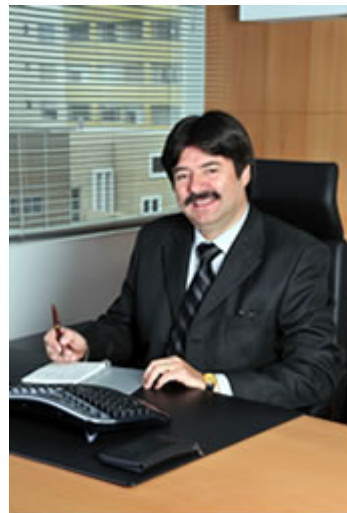
Para ampliar de Clic en la foto