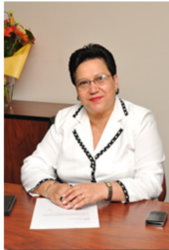
Para ampliar de Clic en la foto