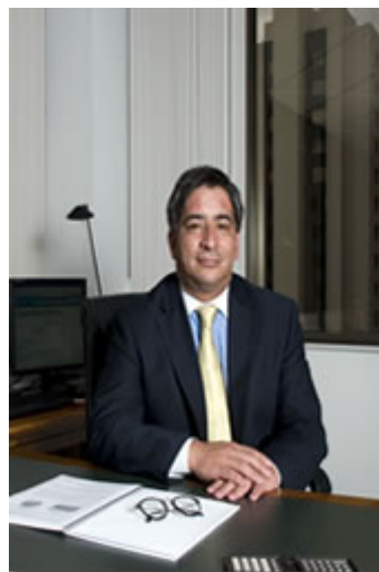
Para ampliar de Clic en la foto