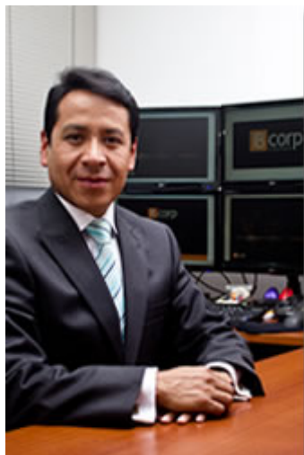
Para ampliar de Clic en la foto