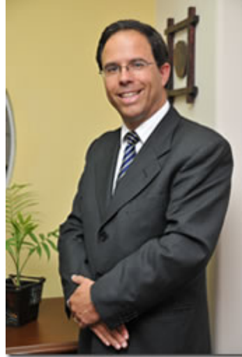
Para ampliar de Clic en la foto