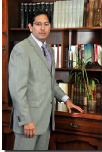
Para ampliar de Clic en la foto