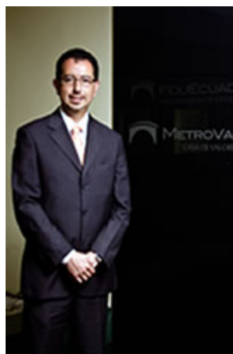
Para ampliar de Clic en la foto