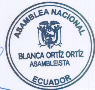
Blanca Ortíz Ortíz ASAMBLEÍSTA DE LOS MIGRANTES POR ESTADOS UNIDOS Y CANADÁ